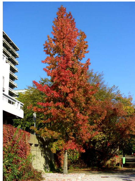
Abb. 2: Amerikanischer Amberbaum im Herbst an der Ruhr-Universität Bochum (A. JAGEL).

Winterkahle Gehölze verdunsten auch im Winter nach Abwurf der Blätter trotzdem weiterhin Wasser über ihre Triebe, auch wenn die Transpirationsrate dabei natürlich wesentlich geringer ist als im belaubten Zustand. Dies stellt dann kein Problem dar, wenn aus dem Boden ausreichend Wasser nachgeliefert werden kann. Ist das Bodenwasser jedoch gefroren, kann es nicht mehr von der Wurzel aufgenommen werden. Gehölze vertragen zwar einen gewissen Austrocknungsgrad, wird dieser aber überschritten, treten ernste Trockenschäden auf. Diese äußern sich zunächst im Eintrocknen der Triebspitzen und Knospen und später auch größerer Triebe. Im schlimmsten Fall kann die gesamte Pflanze vertrocknen. In diesem Fall spricht man von Frosttrocknis, welche man bei uns im Winter besonders häufig an immergrünen, fremdländischen Ziergehölzen wie z. B. beim Kirschlorbeer ( Prunus laurocerasus ) oder der Aukube ( Aucuba japonica ) beobachten kann.