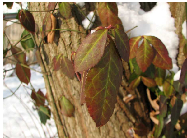
Abb. 6: Herbstlich gefärbtes Blatt eines Kletter-Spindelstrauches ( Euonymus fortunei ) (V. M. DÖRKEN).