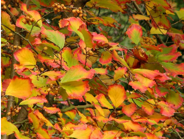
Abb. 11: Frühlings-Zaubernuss ( Hamamelis vernalis ) (V. M. DÖRKEN).

Unter den in Mitteleuropa häufiger gepflanzten Ziergehölzen färben besonders stark aus: Tulpenbaum ( Liriodendron tulipifera : goldgelb, Abb. 9), Ginkgo ( Ginkgo biloba : goldgelb, Abb. 10), Zaubernüsse ( Hamamelis spp.: gelb, orange bis rot, Abb. 11), Amberbaum ( Liquidambar styraciflua : rot bis pflaumenblau, Abb. 12), Fächer-Ahorn ( Acer palmatum : gelb bis karminrot, Abb. 13) und Sumpf-Eiche ( Quercus palustris : rötlich bis scharlachrot, Abb. 14).