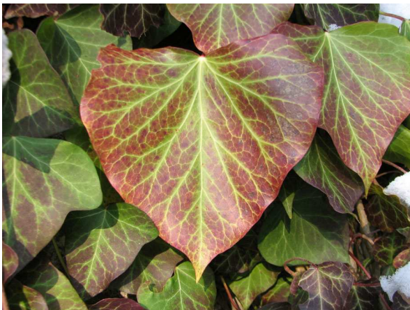
Abb. 5: Herbstlich gefärbtes Efeublatt ( Hedera helix ).

Besonders die Anthocyane sind verantwortlich für die leuchtend roten Farben (STEINECKE & al. 2008). Sie werden beim Abbau des Chlorophylls verstärkt gebildet, ohne dass hierfür ein besonderer "biologischer Sinn" erkennbar ist. Möglicherweise handelt es sich lediglich um ein Nebenprodukt der auf Hochtouren laufenden Abbauprozesse (MOHR & SCHOPFER 1985). Eine Notwendigkeit eines besonders starken Schutzes gegen schädliche UV-Strahlung zu diesem Zeitpunkt erscheint nicht einleuchtend. Auch einige immergrüne Arten wie z. B. Efeu ( Hedera helix ) und Kletter-Spindelstrauch ( Euonymus fortunei ) bilden im Winter verstärkt Anthocyane (Abb. 5 & 6), wobei es sich um eine Art Frostschutz oder einen Schutz vor der winterlichen Sonne handeln könnte, da die Pflanzen nach dem herbstlichen Blattfall um sie herum plötzlich stärkere Sonneneinstrahlung ertragen müssen.