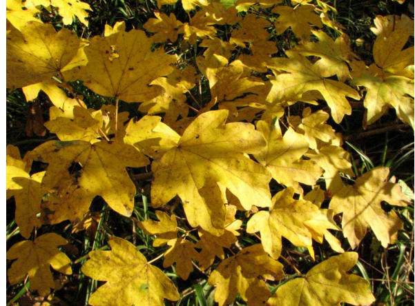
Abb. 4: Feld-Ahorn ( Acer campestre ) (V. M. DÖRKEN).

Besonders die Anthocyane sind verantwortlich für die leuchtend roten Farben (STEINECKE & al. 2008). Sie werden beim Abbau des Chlorophylls verstärkt gebildet, ohne dass hierfür ein besonderer "biologischer Sinn" erkennbar ist. Möglicherweise handelt es sich lediglich um ein Nebenprodukt der auf Hochtouren laufenden Abbauprozesse (MOHR & SCHOPFER 1985). Eine Notwendigkeit eines besonders starken Schutzes gegen schädliche UV-Strahlung zu diesem Zeitpunkt erscheint nicht einleuchtend. Auch einige immergrüne Arten wie z. B. Efeu ( Hedera helix ) und Kletter-Spindelstrauch ( Euonymus fortunei ) bilden im Winter verstärkt Anthocyane (Abb. 5 & 6), wobei es sich um eine Art Frostschutz oder einen Schutz vor der winterlichen Sonne handeln könnte, da die Pflanzen nach dem herbstlichen Blattfall um sie herum plötzlich stärkere Sonneneinstrahlung ertragen müssen.