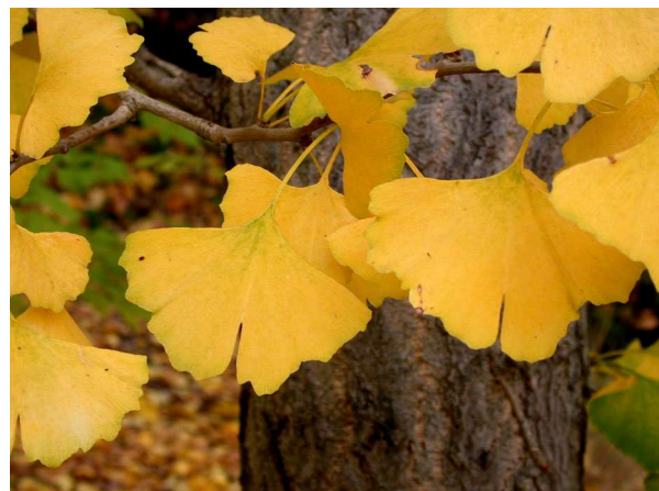
Abb. 10: Ginkgo ( Ginkgo biloba ) (A. HÖGGEMEIER).