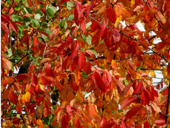
Abb. 3: Vogel-Kirsche ( Prunus avium ) (V. M. DÖRKEN).

Wird im Herbst das grün gefärbte Chlorophyll abgebaut, treten andere, ebenfalls im Blatt bereits vorhandene lichtabsorbierende Photosynthesepigmente verstärkt zum Vorschein, die bisher von Chlorophyll farblich überdeckt wurden. Hierbei handelt es sich um Anthocyane sowie um Carotinoide, die man in Carotine und Xanthophylle mit Lutein als Hauptvertreter unterteilt. Durch sie färben sich die Blätter nun leuchtend rot (Abb. 3) oder kräftig gelb (Abb. 4). Orange als Mischfarbe ist ebenfalls ein häufiger Farbton.