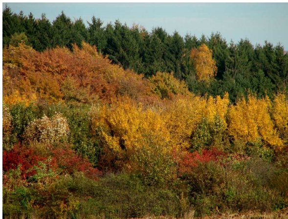
Abb. 1: Herbstlicher Laubwald in Ennepetal-Homberge/Westfalen (V. M. DÖRKEN).

In unseren Breiten stellt der jährliche Laubabwurf als Anpassung an die winterlichen Fröste und an die verkürzte Tageslänge für den Großteil der Gehölze die beste Überlebensstrategie dar, den Winter mehr oder weniger schadlos zu überstehen. So sind fast alle in Deutschland heimischen Gehölze bis auf sehr wenige Ausnahmen z. B. Buchsbaum ( Buxus sempervirens ), Efeu ( Hedera helix ) oder Stechpalme ( Ilex aquifolium ) im Winter kahl. Bevor die Blätter der winterkahlen (oder auch "sommergrünen" genannten) Gehölze aber abgeworfen werden, kommt es zur teils spektakulären Verfärbung unserer Wälder, Hecken und Ziergehölze (Abb. 1 & 2).