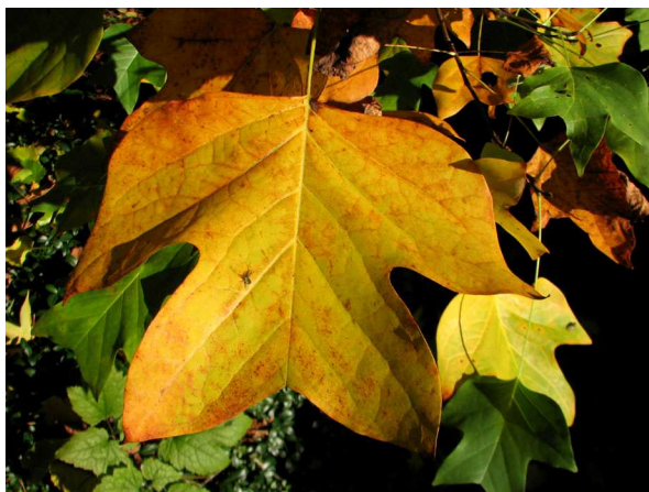
Abb. 9: Amerikanischer Tulpenbaum ( Liriodendron styraciflua 1 ) (V. M. DÖRKEN).