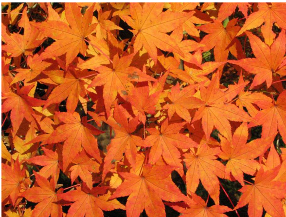
Abb. 13: Fächer-Ahorn ( Acer palmatum ) (V. M. DÖRKEN).