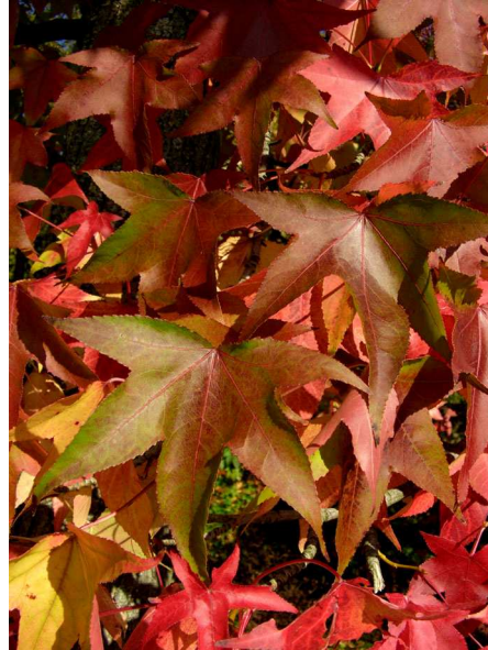
Abb. 12: Amerikanischer Amberbaum ( Liquidambar styraciflua ) (A. JAGEL).