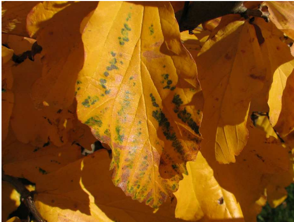
Abb. 15: Eisenholz ( Parrotia persica ), Herbstblätter mit grünen Inseln.

Die Blattalterung wird durch den Anstieg der seneszenzfördernden Phytohormone Abscisinsäure und Ethylen bei einer gleichzeitigen Abnahme von Auxinen, Gibberellinen und Cytokininen beschleunigt. Letzteres stellt das wichtigste seneszenzhemmende Phytohormon dar. Nicht selten sind auf bereits stark seneszenten oder auch bereits abgeworfenen Blättern immer noch frischgrüne Flecken erkennbar (Abb. 15 & 16). Diese grünen Inseln sind auf lokale durch parasitische Pilze, Bakterien oder Insektenlarven bedingten Cytokinin-Ausschüttungen zurückzuführen (BRESINSKY & al. 2008). Die so erhalten gebliebenen grünen Regionen bieten den parasitierenden Organismen entsprechend noch für eine längere Zeit ausreichend Nährstoffe.