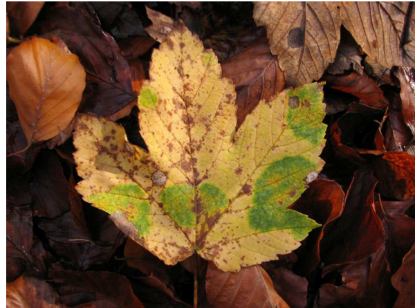
Abb. 16: Berg-Ahorn ( Acer pseudoplatanus ), Herbstblätter mit grünen Inseln.

Bei sehr frühen Frösten kann es auch zu einem vorzeitigen Abwurf noch grüner Blätter kommen. Auch wenn die Blätter in ein bis zwei Wochen ohnehin abgeworfen würden, stellt dies durch den Verlust der Nährstoffe einen ernstzunehmenden Frostschaden dar. So geschädigte Individuen treiben in der kommenden Vegetationsperiode deutlich schütterer aus (DÖRKEN & STEINECKE 2010). Es gibt jedoch auch einige heimische Vertreter wie die Erlen ( Alnus spec. ), die den überwiegenden Teil des Laubes im grünen Zustand ohne nennenswerte Herbstfärbung abwerfen. Da Erlen mit in Wurzelknöllchen lebenden Luftstickstoff fixierenden Bakterien ( Rhizobium spec. ) in Symbiose leben, könnte dies die Erklärung dafür sein, warum auf eine jährliche herbstliche Rückführung des Stickstoffs aus den Blättern verzichtet werden kann. Stickstoff steht den Pflanzen hier offensichtlich in ausreichendem Maße zur Verfügung.