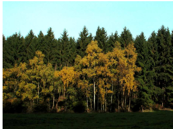
Abb. 8: Hänge-Birke ( Betula pendula ) in Ennepetal-Homberge/Westfalen (V. M. DÖRKEN).