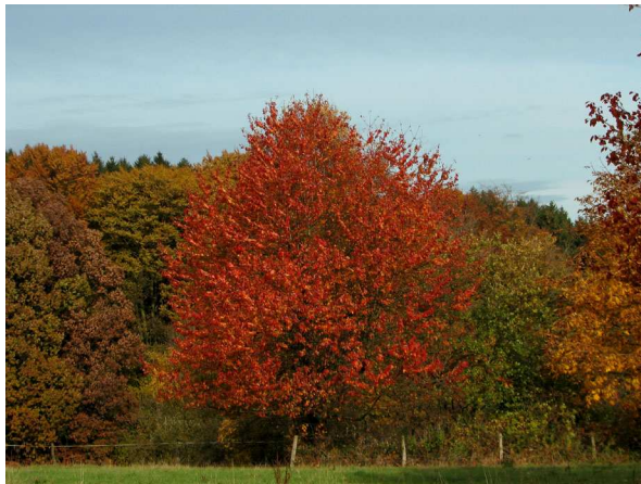
Abb. 7: Vogel-Kirsche ( Prunus avium ) in Ennepetal-Homberge/Westfalen (V. M. DÖRKEN).

Der Chlorophyll-Abbau und die darauffolgende Herbstfärbung werden besonders durch einen starken Temperaturgradienten zwischen Tag und Nacht bedingt. Warme, sonnige Tage und ausstrahlungsreiche, kalte Nächte fördern eine intensive Herbstfärbung. Daher ist die Herbstfärbung im atlantisch/subatlantisch geprägten Mitteleuropa nicht in jedem Jahr gleich intensiv, weil hier intensive Temperaturunterschiede zwischen Tag und Nacht mitunter fehlen können. Anders hingegen im östlichen Nordamerika. Aufgrund der dortigen stabileren klimatischen Bedingungen kann man jedes Jahr eine intensive, spektakuläre Herbstfärbung erwarten, die weithin als "Indian Summer" bekannt ist und durch eine verstärkte Anthocyan-Synthese bedingt wird. Hier färben besonders Arten wie der Rot-Ahorn ( Acer rubrum ) oder der Zucker-Ahorn ( Acer saccharum ) ab Mitte September die ausgedehnten Waldlandschaften kräftig orange bis rot. In Mitteleuropa sind bspw. Vogel-Kirsche ( Prunus avium , gelb, orange bis scharlachrot, Abb. 7), Feld-Ahorn ( Acer campestre , goldgelb, Abb. 4), Spitz-Ahorn ( Acer platanooides , gelb bis orange-rot), Hänge-Birke ( Betula pendula : leuchtend goldgelb, Abb. 8) oder Europäische Lärche ( Larix decidua : kräftig goldgelb) die wohl intensivsten Herbstfärber. Anfang bis Mitte November, nachdem alle übrigen heimischen, winterkahlen Gehölze ihr Laub abgeworfen haben, fangen Birken und Lärchen als die letzten heimischen Baum-Arten an auszufärben.