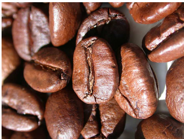
Abb. 11: Geröstete Kaffeebohnen (A. HÖGEMEIER).

Bei der Verarbeitung und Aufbereitung der Kaffeekirschen zur Handelsware werden zuerst die gesamte Fruchtwand und das Silberhäutchen entfernt. In dieser Form spricht man von Rohkaffee, der das Endosperm samt Embryo umfasst. Graugrüner Rohkaffee kommt in die Großröstereien der Verbraucherländer, in denen das Rösten sowie die Zusammenstellung der Sorten nach Geschmacksvorlieben stattfindet. Die Zubereitung erfolgt zum Teil regional unterschiedlich als Aufguss direkt in der Tasse oder durch einen Filter, durch Extraktion unter hohem Druck wie beim Espresso oder als löslicher Kaffeeextrakt. Daneben gibt es die verschiedensten Kombinationen z. B. mit Milch als Milchkaffee, Cappuccino oder Latte macchiato. So werden in großen Kaffeehausketten bis zu 40 verschiedene Kaffeegetränke angeboten – von "Strawberries & Cream Frappuccino® blended beverage" bis zum weihnachtlichen "Lebkuchen Latte" (www.starbucks.de). Die modernste Entwicklung in der Kaffeeindustrie sind zahlreiche Varianten von Kaffeemaschinen, die mit Pads oder Kapseln funktionieren (Abb. 13).