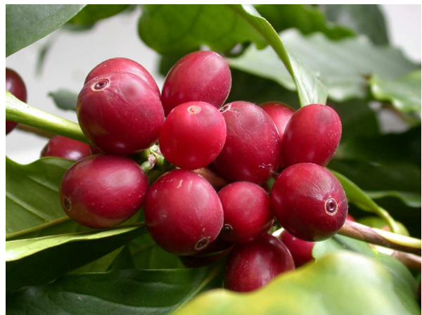
Abb. 8: Coffea arabica , Reife Kaffee-Früchte, sog. "Kaffeeirschen".

Nach der Befruchtung dauert es sieben bis neun Monate, je nach Art und Sorte, bis die zunächst grünen Früchte zu roten Steinfrüchten, den sogenannten Kaffeeirschen, heranreifen. Die Kaffeeirschen haben außen eine saftige Fruchtwand, das Exo- und Mesokarp, und nach innen (meist) 2 feste Steinkerne, die von der harten inneren Fruchtwand, dem