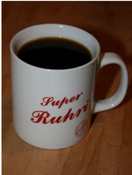
Abb. 1: Ne Tass Kaff (C. BUCH).

Kopfschmerzen. Im Mund eine tote Ratte. Draußen ist es hell. Eigenes Bett – soweit alles klar. Im Flur Schuhe, Hose, leere Sektkflaschen, zerknüllte Luftschlangen, Erinnerungsfetzen. Im Wohnzimmer schnarcht etwas. Küche. Vorbei an schmutzigem Geschirr, noch mehr leeren Flaschen, Undefinierbarem. Ein Plan muss her. Aber erst mal ein Kaffee!