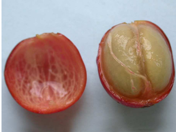
Abb. 9: Coffea arabica , Geöffnete Kaffeekirsche mit rotem fleischigem Mesokarp und den von festem, hornartigem Endokarp umgebenen Samen (Steinkerne) (A. HÖGEMEIER).

Endokarp, umgeben sind. Die beiden Steinkerne liegen sich mit ihren abgeflachten Seiten gegenüber (Abb. 9). Gelegentlich entwickelt sich nur eine Samenanlage zu einem ovalen Kern, der als Perlkaffee bezeichnet wird. Unter dem Endokarp liegt die Samenschale, das sog. Silberhäutchen. Das Silberhäutchen umgibt das Nährgewebe, Endosperm, mit dem darin liegenden S-förmigen Embryo (Abb. 10). Reste dieses Silberhäutchens sind in der Furche der gerösteten Kaffeebohnen manchmal zu finden.