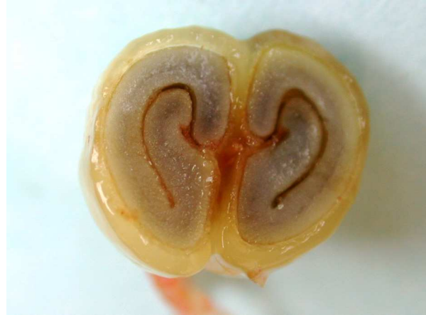
Abb. 10: Coffea arabica , Querschnitt durch den Steinkern einer Kaffeekirsche mit Endosperm und S-förmigem Embryo (A. HÖGEMEIER).