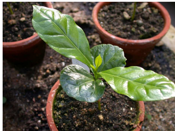
Abb. 4: Coffea arabica , Kaffee-Sämlinge (A. HÖGGEMEIER).