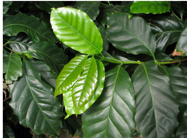
Abb. 2: Coffea arabica (gegenständige Belaubung) (V. M. DÖRKEN).