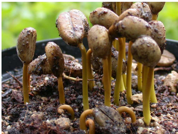
Abb. 3: Coffea arabica , Kaffee-Keimlinge.

Was uns an diesem Neujahrsmorgen ganz weit nach vorne bringt, gehört zur wirtschaftlich wichtigsten Gattung aus der großen, weltweit verbreiteten Pflanzenfamilie der Rubiaceae und zur Gattung Coffea . Die am häufigsten kultivierten Arten sind C. arabica (Arabica-Kaffee), ursprünglich aus Äthiopien und Sudan, und C. canephora (Robusta-Kaffee), der ursprünglich aus W- und C-Afrika, Sudan, Uganda und Angola stammt (JENNY & STEINECKE 1999).