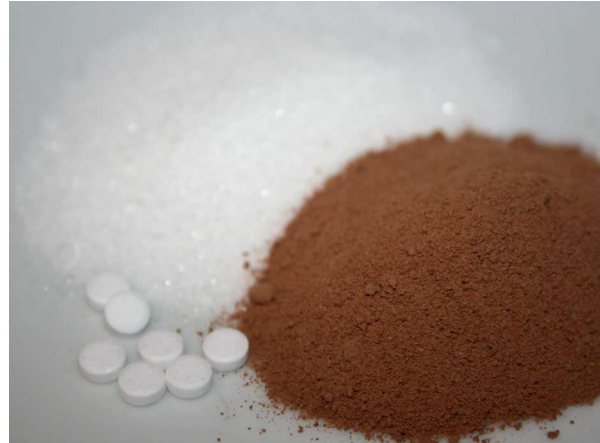
Abb. 14: Zutaten zum Kaffee: Zucker, Süßstoff, Kakao (C. BUCH).

Skurril ist die Verwendung von Kaffeebohnen, die vor Ihrer Weiterverarbeitung von auf den Inseln Sumatra und Java lebenden Schleichkatzen gefressen, ausgeschieden und dadurch fermentiert wurden. Dieses Kaffeeprodukt ist durch diesen aufwändigen "Umweg" extrem teuer.