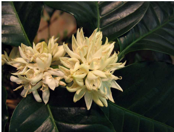
Abb. 5: Coffea arabica , Blühender Kaffeestrauch.

In den Achseln der gegenständigen, ledrig-glänzenden Blätter (Abb. 2) entwickeln sich vielblütige Trugdolden mit weißen, sternförmigen Blüten. Sie haben eine fünfzählige Kronröhre und fünf damit verwachsene Staubblätter (Abb. 5 & 6), einen unterständigen Fruchtknoten (Abb. 7) mit zwei Samenanlagen und einem Griffel mit zwei Narben (Abb. 6).