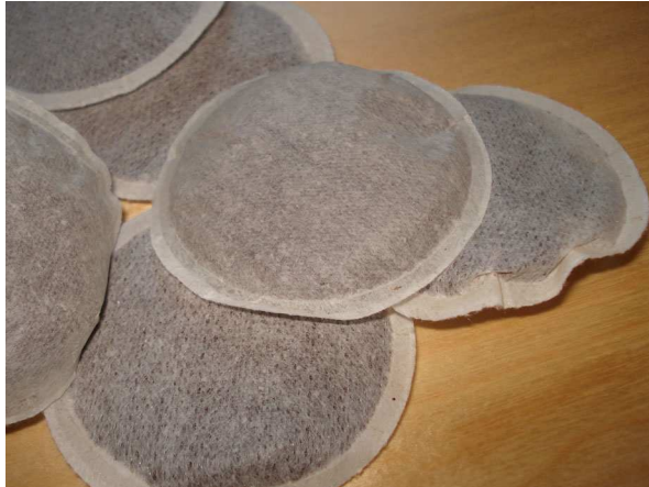
Abb. 13: Kaffeepads (I. HETZEL).