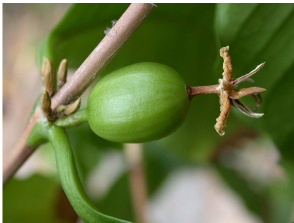
Abb. 7: Coffea arabica , Junge Kaffee-Frucht (unterständiger Fruchtknoten) mit eingetrockneten Resten der Blütenhülle (A. HÖGGEMEIER).