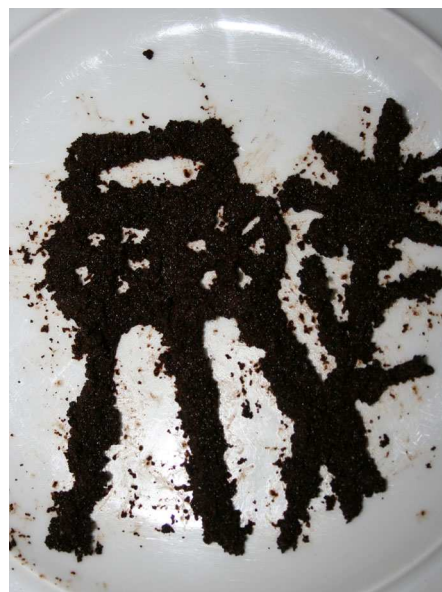
Abb. 16: Dieser Kaffeesatz sagt viele bemerkenswerte Pflanzenfunde in Bochum für das Jahr 2012 voraus (C. BUCH).