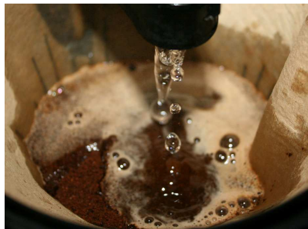
Abb. 12: Filterkaffee (C. BUCH).