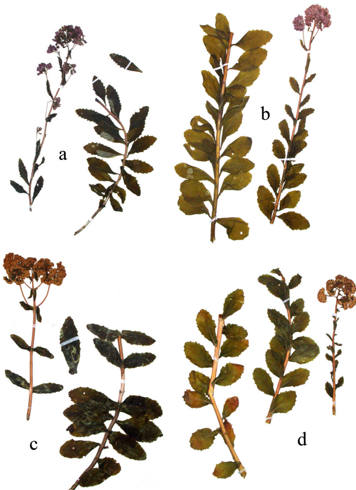
Abb. 7: Herbarbelege der Hylotelephium telephium -Gruppe:

a) Hylotelephium vulgare , Widdau, Kreis Aachen/NRW, 5403/24 (29.08.2005)