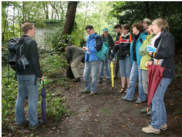
Exkursionsgruppe (C. BUCH).

Das Naturschutzgebiet rund um das Casino und die Burgruine Hohensyburg im Dortmunder Süden gehört geografisch zum Ardeygebirge an der Nordgrenze des Süderberglandes. An den flachgründigen, bis zu 150 m zum Hengsteysee hin abfallenden Südhängen des Sybergs (= Burgberg) ist v. a. das Luzulo-Quercetum (Hainsimsen-Traubeneichenwald) anzutreffen. Diese bodensauren und trockenen Hangwälder stocken hier auf flözführenden Schichten des Oberkarbons aus Sandsteinen mit Schiefertönen und Sandschiefern. Am Westhang des Sybergs sind noch ehemalige Stollenmundlöcher, Halden und Pingen zu erkennen, die zum Abbau des ersten abbauwürdigen Steinkohleflözes des Ruhr-Beckens entstanden sind. Bemerkenswert sind die Wälder u. a. wegen ihrer ungewöhnlich großen Anzahl an spontanen Verjüngungen der Europäischen Eibe ( Taxus baccata ).