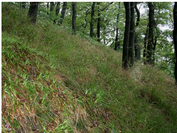
Hang mit Schmalblättriger Hainsimse ( Luzula luzuloides ) und Wald-Hainsimse ( Luzula sylvatica ) (C. BUCH).