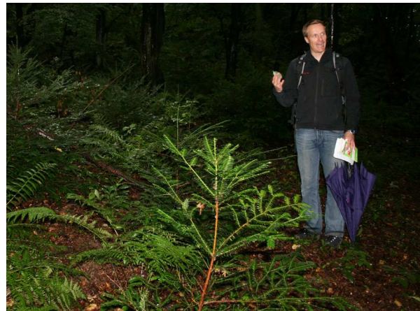
Verwilderte Eiben ( Taxus baccata ) (C. BUCH).