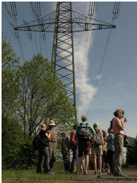
Abb. 3: Botanik unter Strom.

Senecio vulgaris – Gewöhnliches Greiskraut Silene latifolia subsp. alba – Weiße Lichtnelke Sisymbrium officinale – Weg-Rauke Solidago gigantea – Späte Goldrute Sonchus arvensis – Acker-Gänsedistel Sorbus aucuparia – Eberesche, Vogelbeere Spergularia rubra – Rote Schuppenmiere Stachys sylvatica – Wald-Ziest Stellaria media – Gewöhnliche Vogelmiere Stellaria pallida – Bleiche Vogelmiere (Abb. 2) Tanacetum vulgare – Rainfarn Trifolium arvense – Hasen-Klee Trifolium dubium – Kleiner Klee Trifolium pratense – Rot-Klee Trifolium repens – Kriechender Klee, Weiß-Klee Tripleurospermum perforatum – Geruchlose Kamille Tussilago farfara – Huflattich Urtica dioica – Große Brennnessel Verbena officinalis – Eisenkraut Veronica arvensis – Feld-Ehrenpreis Veronica persica – Persischer Ehrenpreis Veronica serpyllifolia – Quendelblättriger Ehrenpreis Viburnum lantana – Wolliger Schneeball Vicia angustifolia subsp. segetalis – Acker- Schmalblattwicke Viola arvensis – Acker-Stiefmütterchen Vulpia myuros – Mäuseschwanz-Federschwingel