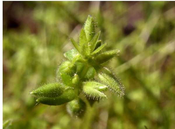
Abb. 2: Stellaria pallida – Bleiche Vogelmiere.

Weiter ging es über die beeindruckende Schleuse auf die gegenüberliegende Seite des Rhein-Herne-Kanals, an dessen Wegrändern und Ufern weiter erklärt, bestimmt und rege diskutiert wurde. Neben weiteren Frühblühern wie Storchschnabel-Arten ( Geranium spp.) wurden erste Wiesengräser gesichtet, die sich weitgehend noch im vegetativen Zustand befanden, sowie einige verwilderte Gartenpflanzen wie das Hasenglöckchen ( Hyacinthoides non-scripta ) gefunden.