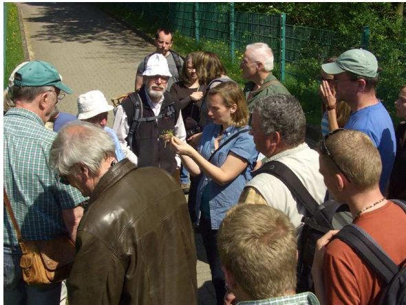
Abb. 1: Stellaria pallida unter genauer Betrachtung (T. KASIELKE).

Bei der Exkursion zum Westhafen des Rhein-Herne-Kanals standen vor allem frühblühende Arten der Stadtflorea auf dem Programm. Auf dem Cranger Kirmesplatz mit seinen mageren Rohbodenflächen aus Asphalt, Beton und Bauschutt wächst eine typische Pioniervegetation, die sich wunderbar eignete, um die "Winterblödheit" aufzuarbeiten, die viele Botaniker alljährlich heimsucht. Daher wurden hier neben einigen Besonderheiten wie dem Triften-Knäuel ( Scleranthus polycarpus ), der den Erstfund für Herne darstellt, auch häufige frühblühende Arten vorgestellt, miteinander verglichen und ihre Bestimmungsmerkmale erläutert. Dazu gehört beispielsweise der Dreifinger-Steinbrech ( Saxifraga tridactylites ). Währenddessen mussten sich die Experten unter den Botanikern mit bestimmungsschwierigen Hornkräutern ( Cerastium spp.) sowie Kleinarten des Frühlings-Hungerblümchens ( Draba verna agg.) herumplagen.