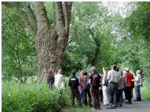
Abb. 4: Populus nigra – Schwarz-Pappel (R. THEBUD-LASSAK)

Ajuga reptans – Kriechender Günsel Alopecurus geniculatus – Knick-Fuchsschwanz Carex hirta – Behaarte Segge Carex otrubae – Falsche Fuchs-Segge Hypericum tetrapterum – Geflügeltes Johanniskraut Impatiens parviflora – Kleines Springkraut Iris pseudacorus – Sumpf-Schwertlilie Juncus inflexus – Blaugrüne Binse Lemna minor – Kleine Wasserlinse Lychnis flos-cuculi – Kuckucks-Lichtnelke Persicaria amphibia – Wasser-Knöterich Ranunculus sceleratus – Gift-Hahnenfuß Symphytum officinale – Arznei-Beinwell Trifolium hybridum – Schweden-Klee Vicia cracca (auch f. albiflora ) – Vogel-Wicke