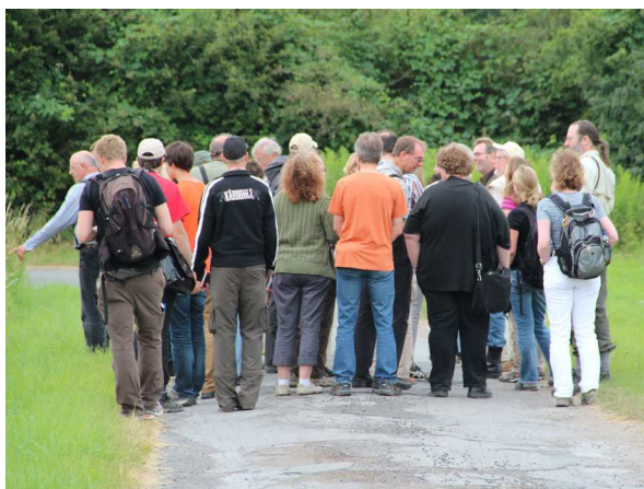
Abb. 1: Exkursionsgruppe im Groppenbruch

Nach einem kurzen Standortwechsel wurde noch der Dortmund-Ems-Kanal mit seiner Ufer- und Wasserflora wie dem Durchwachsenen Laichkraut ( Potamogeton perfoliatus ) aufgesucht. An einem weiteren Regenrückhaltebecken endete die Exkursion.