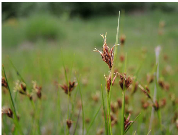
Abb. 5: Rhynchospora fusca (C. BUCH).