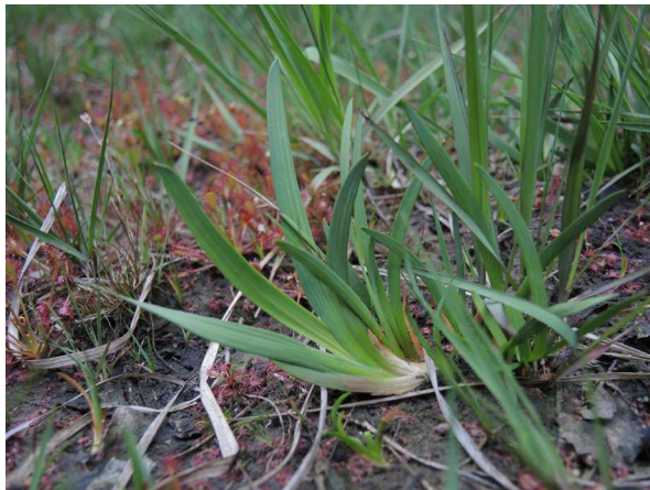
Abb. 3: Narthecium ossifragum (A. JAGEL).

Juncus bufonius – Kröten-Binse Juncus bulbosus – Knollige Binse Juncus conglomeratus – Knäuel-Binse Juncus effusus – Flatter-Binse Juncus squarrosus – Sparrige Binse, RL NRW 3S, NRBU 3S Lycopodiella inundata – Sumpfbärlapp, RL NRW 3S, NRBU 2S Molinia caerulea – Pfeifengras Myrica gale – Gagelstrauch, RL NRW 3, NRBU 3S Narthecium ossifragum – Moor-Ährenlilie, RL NRW S3, NRBU 3S (Abb. 3) Potentilla erecta – Blutwurz Rhynchospora alba – Weißes Schnabelried, RL NRW 3S, NRBU 2S (Abb. 4) Rhynchospora fusca – Braunes Schnabelried, RL NRW 3S, NRBU 2S (Abb. 5) Trichophorum germanicum – Rasen-Haarsimse, RL NRW 3S, NRBU 2S (Abb. 6)