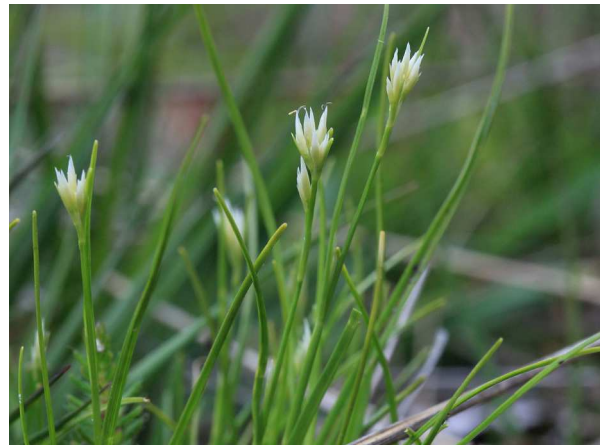
Abb. 4: Rhynchospora alba (C. BUCH).