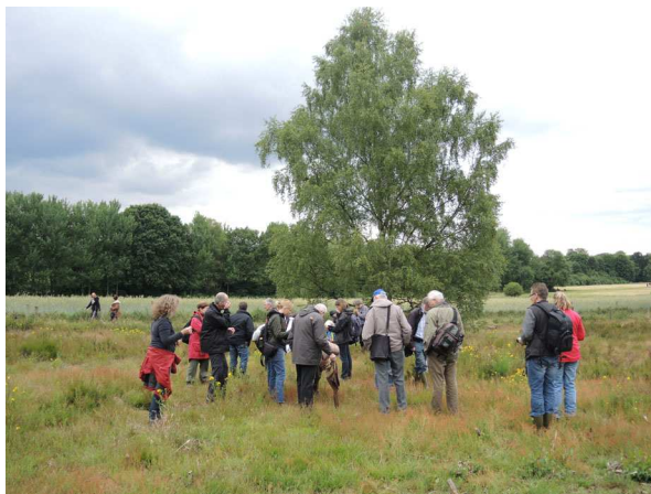
Abb. 1: Heidefläche.

Die Hildener Heide gehört zu den ältesten Naturschutzgebieten in Deutschland und die Flora ist über viele Jahrzehnte (Beginn ca. 1880) sehr gut dokumentiert. Auch wenn schon viele Arten verschollen oder stark rückgängig sind, sind noch viele interessante und für die verschiedenen Lebensräume typische Arten zu finden