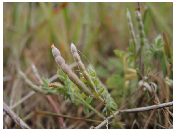
Abb. 2: Ornithopus perpusillus (A. JAGEL).