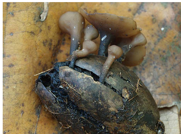
Abb. 4: Ciboria batschiana – Eichel-Stromabecherling (E. HELLMANN).