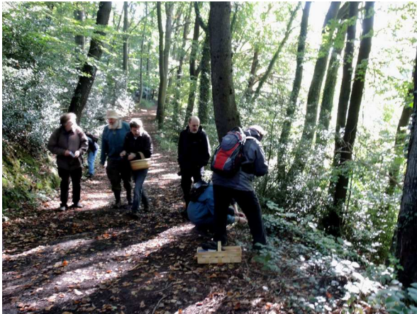
Abb. 1: Im Wald des Stiepeler Mailandsiepens (A. JAGEL).

Beim Mailandsiepen handelt es sich um einen alten, naturnahen Buchenwald mit zahlreichen Feuchtstellen, kleinen Bächen und Siepen am Ruhrhang. Nachdem der Arbeitskreis Pilzkunde Ruhr (APR) das Gebiet im Rahmen des GEO-Tags 2014 am Kemnader See aufgesucht hatte, wurde entschieden, dass es sich lohnt, hier noch einmal eine Exkursion anzubieten. Und so war es auch: Insgesamt 104 Arten wurden in nur drei Stunden gefunden, unter denen sich mit dem Eselsohr auch eine in NRW stark gefährdete Art befand (Gesamtartenliste unter www.pilzkunde-ruhr.de/ ). Da das weitläufige und ergiebige Gebiet auf der Exkursion nur zu einem kleinen Teil begangen werden konnte, wird die Exkursion im kommenden Jahr fortgesetzt.