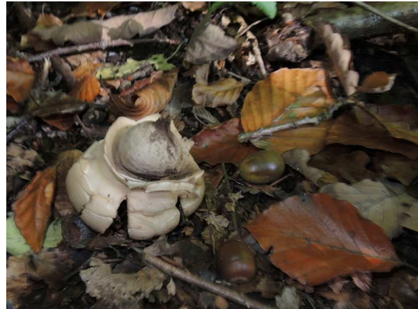
Abb. 2: Geastrum triplex – Halskrausen-Erdstern (A. JAGEL).