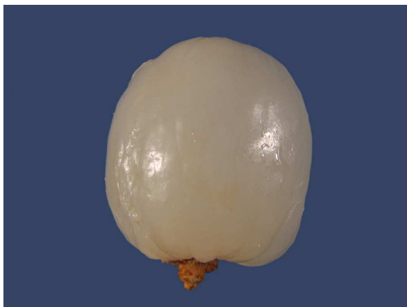
Abb. 7: Litschi ( Litchi chinensis ), gepellte Frucht.

Die Früchte von Litschi und Rambutan sind aufgrund ihres Aufbaus für den Botaniker interessant. Es handelt sich nämlich um einsamige Nüsse, auch wenn sie oberflächlich nicht nach Nüssen aussehen. Ihre gesamte Fruchtwand ("Schale") ist aber, wie für Nüsse typisch, trocken und holzig bzw. ledrig. Das, was man als "Fruchtfleisch" isst und zwischen der Schale und dem großen braunen, länglichen Samen als weiße, fleischige, süßlich schmeckende Schicht ausgebildet ist, ist keine Bildung der Fruchtwand, wie das bei Beeren oder Steinfrüchten der Fall wäre. Es ist aber auch keine fleischig gewordene Samenschale, sondern ein Auswuchs des Samenträgers, an dem der Samen sitzt (Funiculus). Eine solche Struktur nennt man Arillus, sie entspricht dem, was man auch von unseren heimischen Eiben als roten Samenmantel her kennt.