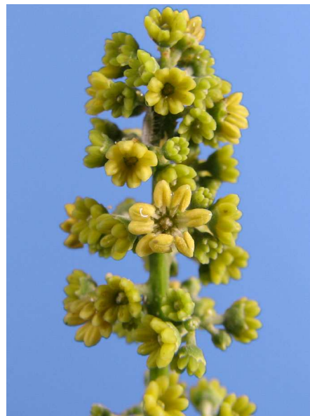
Abb. 4: Nephelium coriaceum , Blütenstand einer dem Rambutan nah verwandten Art (V. M. DÖRKEN).

Die Fruchtschale der Litschi ist aus kleinen fünf- bis sechseckigen Feldern zusammengesetzt (Abb. 5), bei Rambutan ist jedes dieser Felder mit einem langen, spitzen, borstigen Auswuchs versehen (Abb. 6). Darauf nimmt auch die volkstümliche Bezeichnung im Ursprungsland des Rambutans Bezug (rambut = Haar).