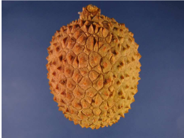
Abb. 5: Litschi ( Litchi chinensis ), reife Frucht (V. M. DÖRKEN).