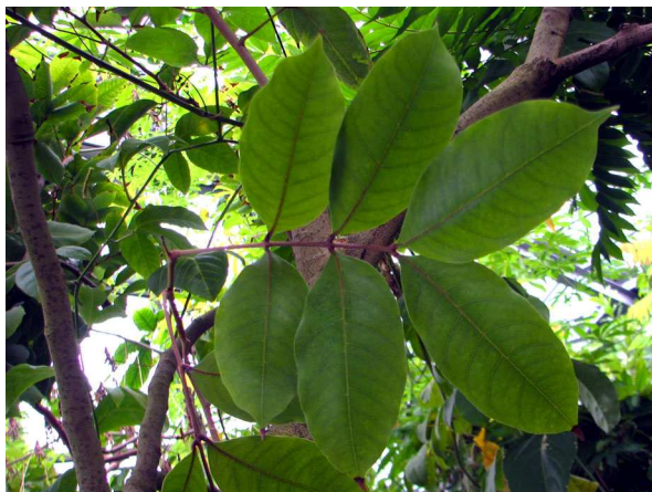
Abb. 3: Litschi ( Litchi chinensis ), Blätter (V. M. DÖRKEN).

Bei beiden Arten handelt es sich um kleine immergrüne Bäume mit wechselständig stehenden, gefiederten Blättern (Abb. 3). Die kleinen Blüten stehen in reichblütigen Blütenständen (Abb. 4). Bei Litschi gibt es auf ein und derselben Pflanze drei verschiedenen Blütentypen: männliche, weibliche und zwittrige (die letzteren sind aber funktionell ebenfalls weiblich, die Staubblätter sind hier nicht funktionstüchtig). Bei Rambutan sind sie sogar auf verschiedene Pflanzen verteilt, sodass es weibliche und männliche Pflanzen gibt (diözisch).