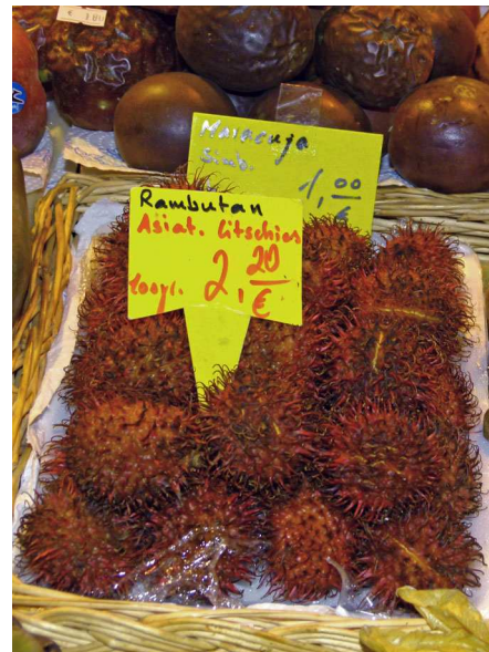
Abb. 2: Rambutan ( Nephelium lappaceum ) auf einem Markt in Frankfurt/Main (H. STEINECKE).