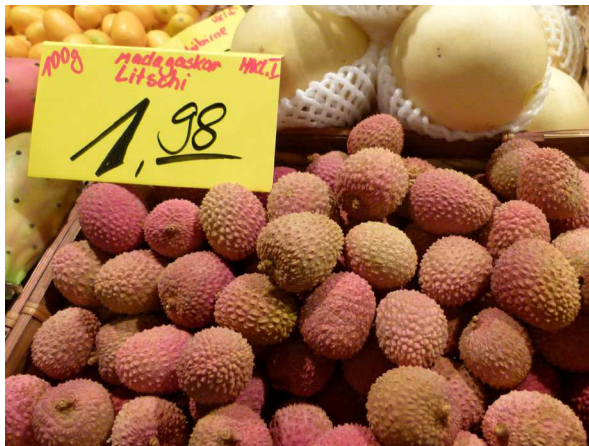
Abb. 1: Litschi ( Litchi chinensis ) auf einem Markt in Frankfurt/Main.

In den letzten Jahren ist bei uns eine Zunahme von exotischen Früchten zu verzeichnen, die besonders in den Wintermonaten im deutschen Lebensmittelhandel angeboten werden (vgl. HETZEL & JAGEL 2011). Viele der exotischen Früchte sind bei uns zwar als Konservenobst schon lange erhältlich, konnten aber erst nach der Verbesserung von Transport- und Lagerungsbedingungen auch als Frischobst angeboten werden. So ist es noch gar nicht allzu lange her, dass es auch die Ananas ( Ananas comosus ) nur in Dosen bei uns zu kaufen gab. Unter den jüngeren Neuigkeiten stechen aus dem Obstsortiment vor allem Litschis ( Litchi chinensis , auch Lychee, Litschiplaume oder Chinesische Haselnuss genannt) und Rambutan ( Nephelium lappaceum , Falsche "Litschi") heraus (Abb. 1 & 2). Aufgrund ihrer eigentümlichen, fast schon künstlich anmutenden Oberflächen sind sie wohl die auffälligsten und ungewöhnlichsten Früchte, die die Frischobsttheken in den letzten Jahren erobert haben. Sie werden vor allem ab der Adventszeit bis in den Januar hinein und mittlerweile auch in den großen Lebensmitteldiscounter-Ketten angeboten. Litschi und Rambutan zählen in Ost-Asien zum beliebtesten Obst. Hier wird die Litschi sogar zu einer der feinsten Früchte der Welt gezählt.