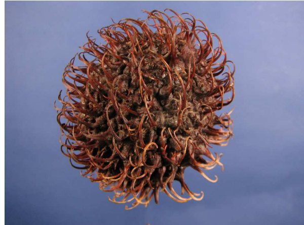
Abb. 6: Rambutan ( Nephelium lappaceum ).

Der Fruchtknoten baut sich aus zwei Fruchtblättern auf, die jeweils nur eine Samenanlage enthalten. Normalerweise entwickelt sich nur ein Fruchtblatt weiter zur Frucht, selten aber auch beide Fruchtblätter. Dann entstehen sog. Zwillingspflaumen, welche bei Litschi in O-Asien als Glückssymbol betrachtet werden (LIEBEREI & REISDORFF 2007).