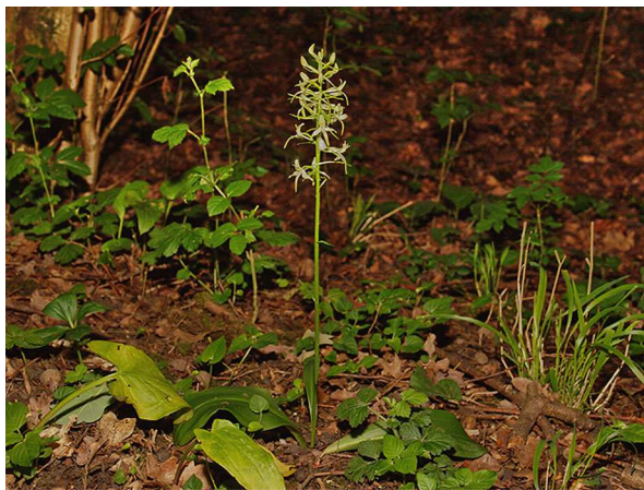
Abb. 1: Platanthera bifolia , blühende Pflanze.

Die Zweiblättrige Waldhyazinthe ( Platanthera bifolia ), auch Weiße Waldhyazinthe genannt) wurde von den Arbeitskreisen Heimische Orchideen in Deutschland zur "Orchidee des Jahres 2011" ausgerufen. Die AHO Deutschlands (AHO) stellen alljährlich eine heimische Orchideenart vor mit dem Ziel, die Öffentlichkeit für den Schutz und Erhalt unserer Orchideen und deren Lebensräume zu sensibilisieren. Die auch in Nordrhein-Westfalen vorkommende Art wird im Folgenden vorgestellt.