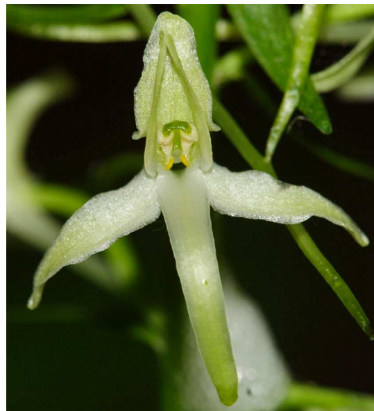
Abb. 2: Platanthera bifolia , Blüte (B. MARGENBURG).