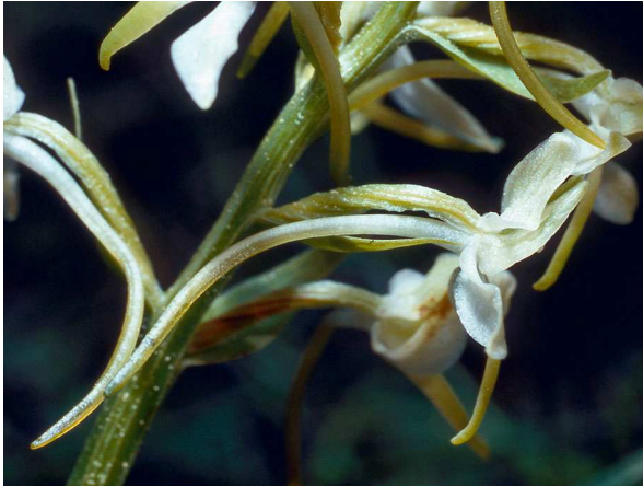
Abb. 3: Platanthera bifolia , Seitenansicht der Blüte mit dem sehr langen Sporn (B. MARGENBURG).