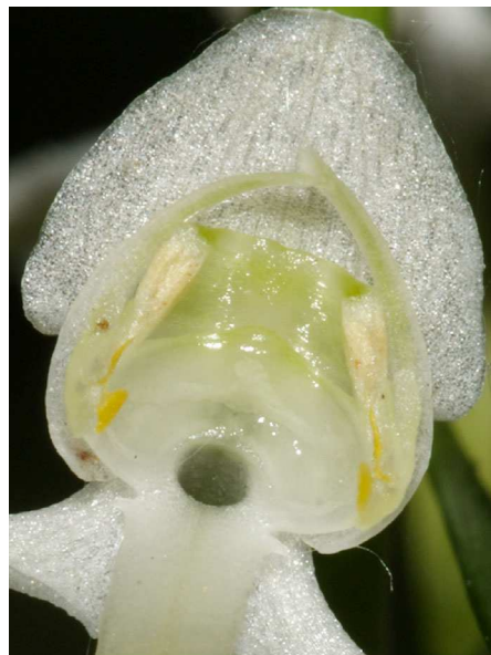
Abb. 8: Platanthera chlorantha mit schräg stehenden Staubbeutel, der Eingang zum Sporn ist deutlich zu erkennen (B. MARGENBURG).