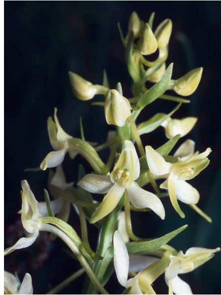
Abb. 4: Platanthera bifolia , Blütenstand (B. MARGENBURG).