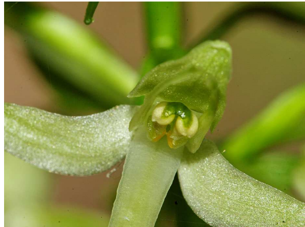
Abb. 6: Platanthera bifolia , Blüte, Aufsicht auf die Staubbeutel (B. MARGENBURG).