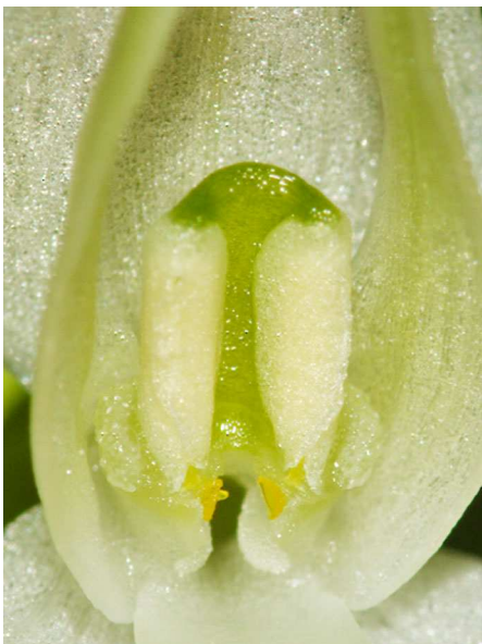
Abb. 7: Platanthera bifolia mit parallel stehenden Staubbeutel, die den Eingang zum Sporn teilweise verdecken (B. MARGENBURG).