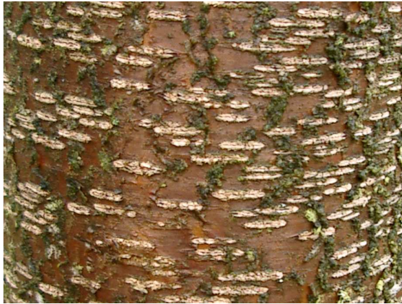
Abb. 3: Mandelbaum mit Ringelborke (V. M. DÖRKEN).

Mandelbäume erinnern habituell an ihre nahen Verwandten, die Pfirsichbäume ( Prunus persica ). Es sind bis 12 m hohe Bäume mit verdornenden Kurztrieben. Die Sprossdornen fehlen allerdings bei den meisten Kultursorten. Der Stamm junger Bäume weist eine ausgeprägte Ringelborke (Abb. 3) auf. Im Alter platzt die Borke auf und wird unregelmäßig längsrissig (Abb. 4). Auch die lanzettlichen Blätter (Abb. 6) ähneln denen des Pfirsichbaums.