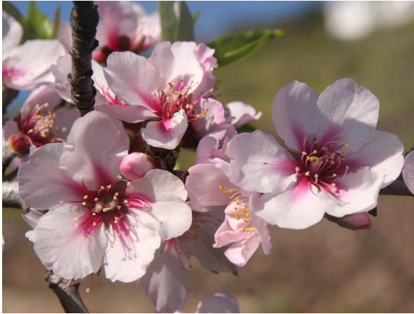
Abb. 7: Mandelblüten (P. SCHUBERT).