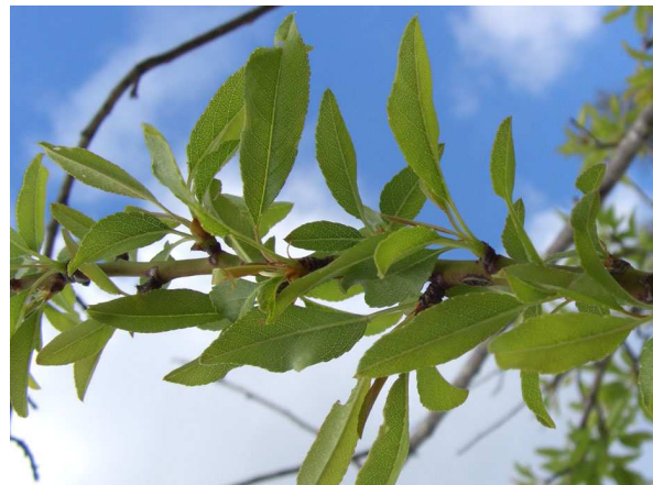
Abb. 6: Mandelzweig auf Mallorca.

Die Blüte erfolgt meist schon vor oder gerade mit dem Laubaustrieb, in milden Regionen bereits ab Februar. Die massenhaft hervorgebrachten Blüten der Mandelbäume zeigen den für Steinobstartigen Rosaceae typischen Blütenaufbau (LEINS & ERBAR 2008). Die fünf Kelchblätter sind klein und unauffällig und bilden eine becherartige Struktur. Die weißen bis leicht rosafarbenen Kronblätter sind frei und haben eine weithin sichtbare Schauwirkung (Abb. 7). Die Blüten haben zahlreiche Staubblätter, aber nur ein Fruchtblatt.