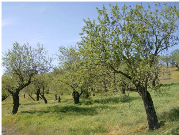
Abb. 5: Mandelhain im Frühling kurz nach der Blüte in Andalusien (T. KASIELKE).