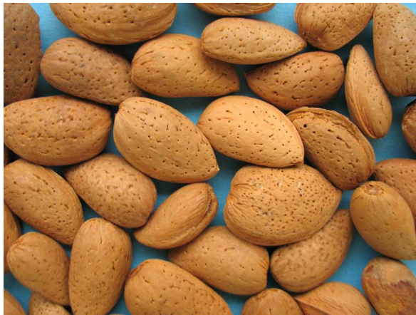
Abb. 1: Mandeln (V. M. DÖRKEN).

Besonders zur Weihnachtszeit finden sich Mandeln in zahlreichen Backwaren und auch als ungeknackte, harte "Nüsse" auf Weihnachtstellern (Abb. 1). Etwa ab Weihnachten bis Ende Februar zeigt sich im Mittelmeergebiet der "Schnee der Algarve": die Mandelblüte (Abb. 2). In diesem Porträt werden die Verwendungen von Mandeln sowie die Biologie der Mandelbäume vorgestellt, mit einem Schwerpunkt auf der Morphologie und den Inhaltsstoffen der Früchte.