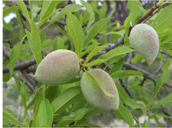
Abb. 8: Mandelfrüchte am Baum (A. JAGEL).