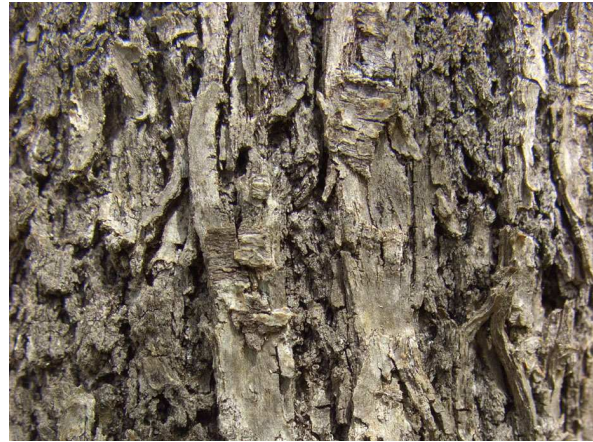
Abb. 4: Borke eines älteren Baumes (A. JAGEL).