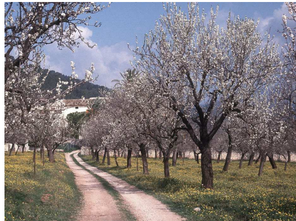
Abb. 2: Mandelblüte auf Mallorca (T. SCHMITT).