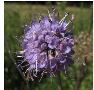
Abb. 18: Teufelsabbiss ( Succisa pratensis), eine geregelte Aufblühreihenfolge ist nicht erkennbar (04.09.2010,).

Zumindest bei anderen Karden kommen aber auch andere Varianten vor, wie bei der Schlitzblättrigen Karde ( Dipsacus laciniatus , Abb. 13) und bei der Schlanke Karde ( Dipsacus strigosus , Abb. 14). Bei der Behaarten Karde ( Dipsacus pilosus ) treten offensichtlich ganz unregelmäßige Aufblühfolgen auf (Abb. 15 & 16). Welche Varianten bei der Aufblühfolge beim Teufelsabbiss existieren, ist offenbar noch gar nicht geklärt, jedenfalls variiert sie auch hier, wie die Abb. 8, 9, 17 & 18 zeigen. Solche Phänomene sind am besten durch Untersuchungen an sehr jungen Stadien mit dem Rasterelektronenmikroskop zu lösen, welche anscheinend bisher nicht vorliegen.