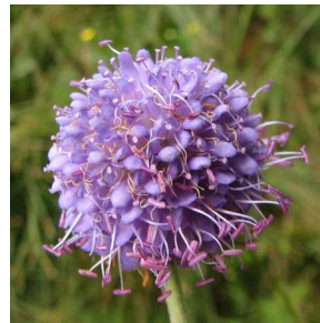
Abb. 17: Teufelsabbiss ( Succisa pratensis), der Blütenstand blüht von oben nach unten auf (09.08.2010,).