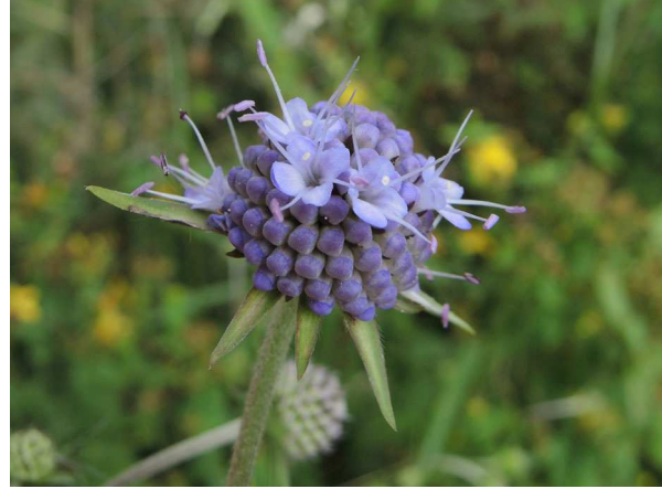
Abb. 8: Teufelsabbiss ( Succisa pratensis), sich öffnender Blütenstand (09.08.2015,).