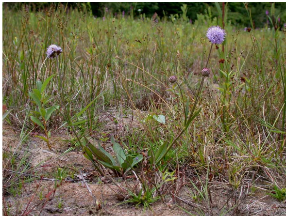
Abb. 1: Succisa pratensis (Teufelsabbiss) auf einer feuchten Brache in Gütersloh (13.07.2004,).

Schon der Name Teufelsabbiss lässt auf mythische Geschichten schließen, die mit der Pflanze verbunden werden. Früher waren die Art und ihre Heilwirkungen viel bekannter. Heute hat sie an Ruhm verloren, vielleicht deswegen, weil sie sehr viel seltener geworden ist und oft nur noch an Stellen wächst, wo sie nicht mehr gepflückt werden darf. Der Teufelsabbiss kommt auch in Nordrhein-Westfalen vor, in den Bergen häufiger als im Flachland. Mittlerweile ist er besonders in der Ebene an vielen Stellen selbst dort verschwunden, wo er zur Zeit der Kartierung der Flora Nordrhein-Westfalens in den 1990er Jahren noch vorkam. Und so ist die Wahl zur Blume des Jahres auch aus nordrhein-westfälischer Sicht gut begründet, weil sie auf den starken Rückgang von Feuchtwiesen, Moor- und Heidegebieten sowie intakter Uferzonen und Gräben im Feuchtgrünland hinweist (vgl. LOKI-SCHMIDT-STIFTUNG 2014, hier auch viele weitere interessante Informationen zum Teufelsabbiss).