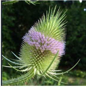
Abb. 11: Wilde Karde ( Dipsacus fullonum), der Blütenstand beginnt im mittleren Bereich (15.07.2008,).