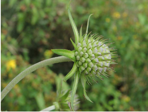
Abb. 7: Teufelsabbiss ( Succisa pratensis), Blütenstand in Knospe (09.08.2015,).