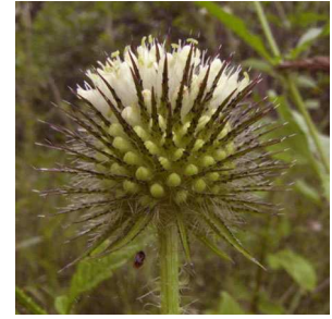
Abb. 14: Schlanke Karde ( Dipsacus strigosus), der Blütenstand beginnt oben mit der Blüte (27.05.2005,).