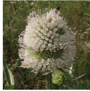
Abb. 13: Schlitzblättrige Karde ( Dipsacus laciniatus), der Blütenstand blüht oben und unten, die Blüten dazwischen sind in Knospe (09.08.2013,).