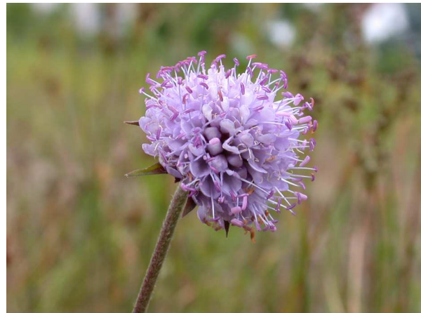
Abb. 2: Succisa pratensis (Teufelsabbiss), Blütenstand (13.07.2004,).