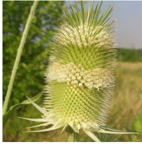
Abb. 12: Schlitzblättrige Karde ( Dipsacus laciniatus), zwei Blütenringe laufen über den Blütenstand (21.07.2006,).