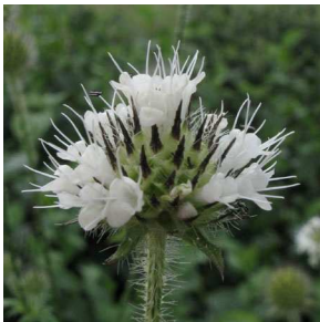
Abb. 15 & 16: Behaarte Karde ( Dipsacus pilosus), eine geregelte Aufblühreihenfolge ist nicht erkennbar (10.08.2010,).