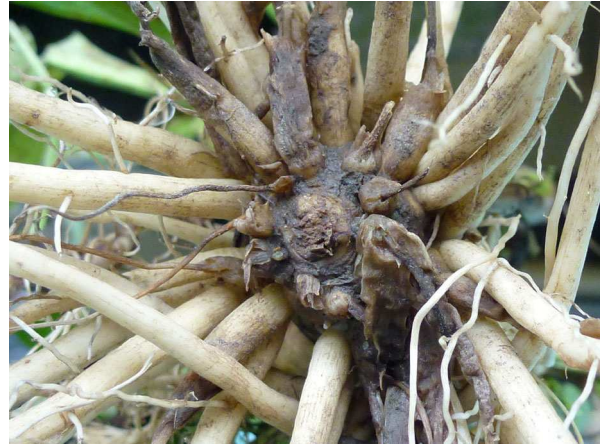
Abb. 4: Teufelsabbiss ( Succisa pratensis), Narbe der abgefaulten Hauptwurzel (23.10.2014,).