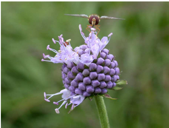
Abb. 9: Teufelsabbiss ( Succisa pratensis) mit Schwebfliege. Die Blüten öffnen sich hier zuerst oben und unten (03.08.2004,).