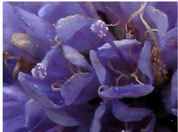
Abb. 6: Teufelsabbiss ( Succisa pratensis), Blüten im weiblichen Zustand, die Staubblätter sind verkümmert, die reifen Narben wurden mit weißen Pollenkörnern bestäubt (14.09.2009,).

Die Blüten sind vormännlich (= protandrisch). In jeder Blüte werden zuerst die Staubblätter reif, dann erst die Narben, was der Verhinderung von Selbstbestäubung dient. Die Staubbeutel haben typischerweise einen geringeren Blauanteil als die Blütenblätter, was zu einem