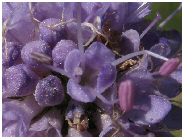
Abb. 5: Teufelsabbiss ( Succisa pratensis), Blüte im männlichen Zustand mit vier Staubblättern, die Narbe ist noch unreif (04.09.2009,).

Die Blüten des Teufelsabbisses sind meist blauviolett und sitzen ungestielt in rundlichen Köpfchen. Sie haben eine verwachsene Blütenkrone mit vier Zipfeln. Die Blütenstände sind von einer Hochblatthülle umgeben und ähneln daher denen von Korbblütlern ( Asteraceae ). Anders als die Korbblütler haben die Blüten des Teufelsabbisses aber z. B. einen Außenkelch und die Staubblätter sind nicht miteinander verwachsen.