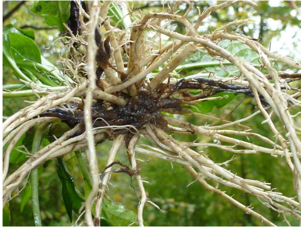
Abb. 3: Teufelsabbiss ( Succisa pratensis), unten abgefaulte Wurzel (23.10.2014,).