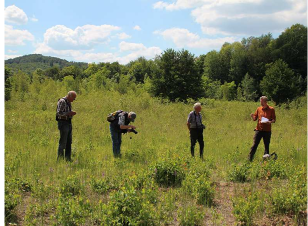
Abb. 2: ... auch im Gelände

Wir bitten um Verständnis für die Umstände, aber sehen dies als einzige Möglichkeit, Exkursionen überhaupt wieder stattfinden zu lassen. Sobald sich die Situation weiter entspannt, bzw. seitens der Behörden als entspannt erklärt wird, werden wir versuchen, wieder zum weitgehend normalen Betrieb überzugehen.