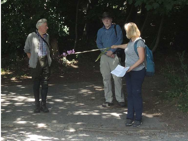
Abb. 1: Einhalten des Mindestabstands...