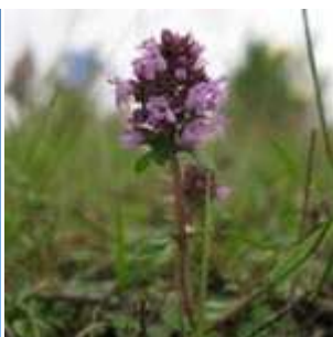
Thymus pulegioides - Feld-Thymian