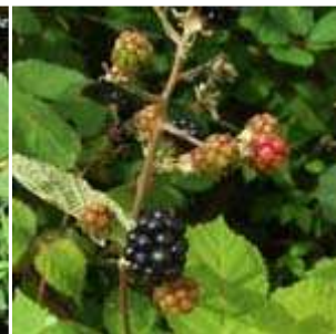
Rubus - Brombeeren (Bilderseite)