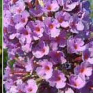
Buddleja davidii - Sommerlieder