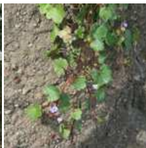
Cymbalaria muralis - Mauer-Zymbelkraut