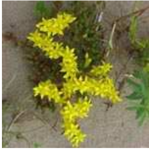
Sedum acre - Scharfer Mauerpfeffer