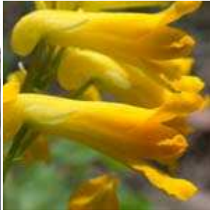
Pseudofumaria lutea - Gelber Lerchensporn