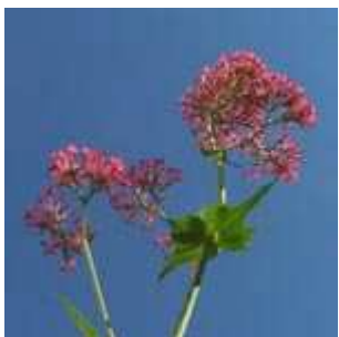
Centranthus ruber - Rote Spornblume