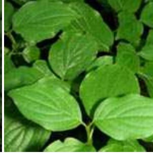
Cornus sanguinea - Blutroter Hartriegel