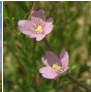
Epilobium tetragonum - Vierkantiges Weidenröschen