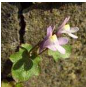
Cymbalaria muralis - Mauer-Zymbelkraut