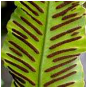
Asplenium scolopendrium - Hirschkungenfarn