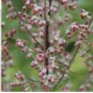
Artemisia vulgaris - Gewöhnlicher Beifuß