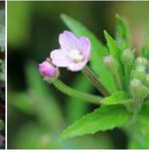
Epilobium parviflorum - Kleinblütiges Weidenröschen