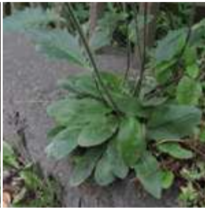
Hieracium lachenalii - Gewöhnliches Habichtskraut