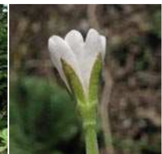
Epilobium lanceolatum - Lanzettblättriges Weidenröschen