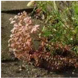
Sedum album - Weiße Fetthenne