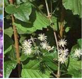
Clematis vitalba - Gewöhnliche Waldrebe