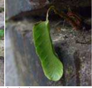
Asplenium scolopendrium - Hirschkungenfarn