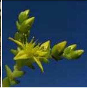
Sedum acre - Scharfer Mauerpfeffer