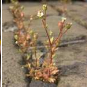
Saxifraga tridactylites - Dreifinger-Steinbrech