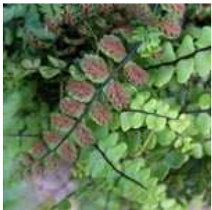
Asplenium trichomanes - Braunstielliger Streifenfarn