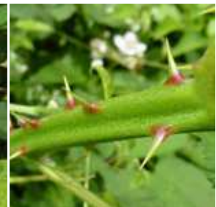
Rubus - Brombeeren (Bilderseite)