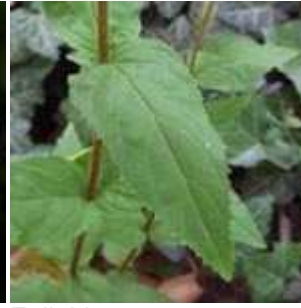
Epilobium montanum - Berg-Weidenröschen