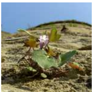
Cymbalaria muralis - Mauer-Zymbelkraut