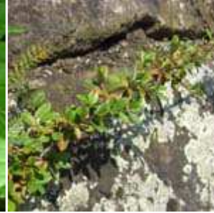
Cotoneaster div. spec - Zwergmispel-Arten