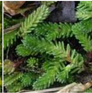
Sedum sexangulare - Milder Mauerpfeffer