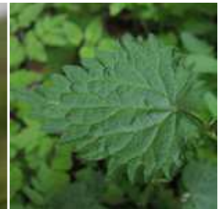
Urtica dioica - Große Brennnessel