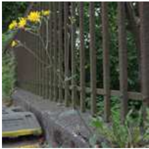
Hieracium lachenalii - Gewöhnliches Habichtskraut