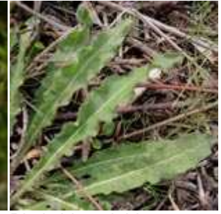
Picris hieracioides - Gewöhnliches Bitterkraut