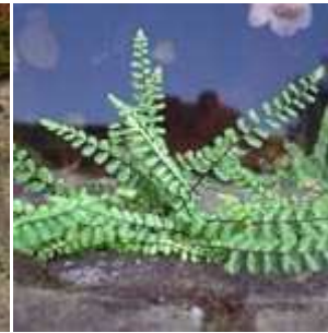
Asplenium trichomanes - Braunstielliger Streifenfarn