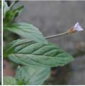
Epilobium roseum - Rosarotes Weidenröschen