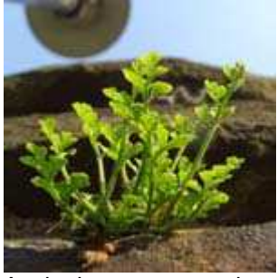
Asplenium ruta-muraria - Mauerraute