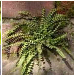
Asplenium trichomanes - Braunstielliger Streifenfarn