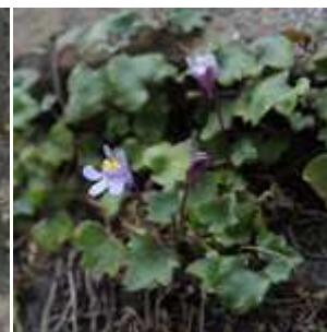
Cymbalaria muralis - Mauer-Zymbelkraut