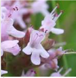
Origanum vulgare - Wilder Dost