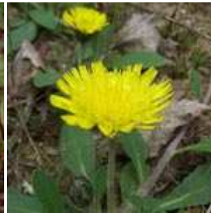
Hieracium pilosella - Kleines Habichtskraut