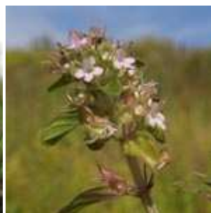
Thymus pulegioides - Feld-Thymian