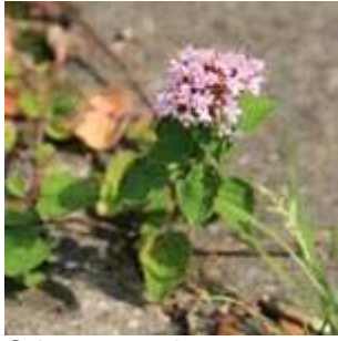
Origanum vulgare - Wilder Dost