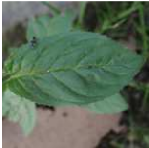
Epilobium roseum - Rosarotes Weidenröschen