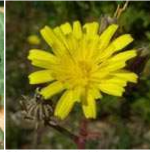
Picris hieracioides - Gewöhnliches Bitterkraut