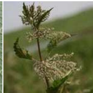
Urtica dioica - Große Brennnessel