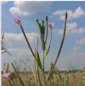
Epilobium tetragonum - Vierkantiges Weidenröschen