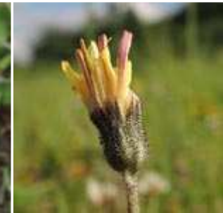
Hieracium pilosella - Mausohr-Habichtskraut