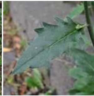
Hieracium lachenalii - Gewöhnliches Habichtskraut