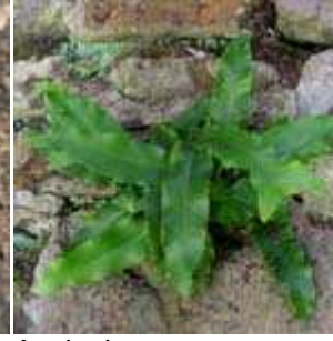
Asplenium scolopendrium - Hirschkungenfarn