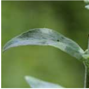
Epilobium parviflorum - Kleinblütiges Weidenröschen