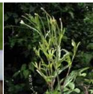
Epilobium lanceolatum - Lanzettblättriges Weidenröschen