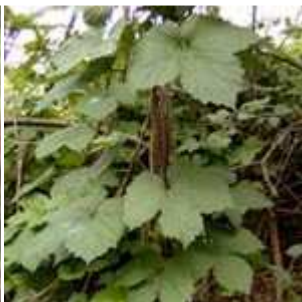
Humulus lupulus - Hopfen