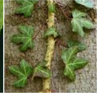
Hedera helix - Gewöhnlicher Efeu