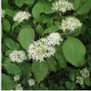
Cornus sanguinea - Blutroter Hartriegel