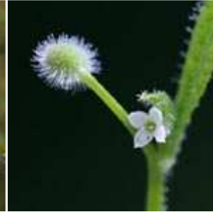
Galium aparine - Kletten- Labkraut