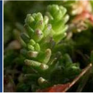
Sedum acre - Scharfer Mauerpfeffer