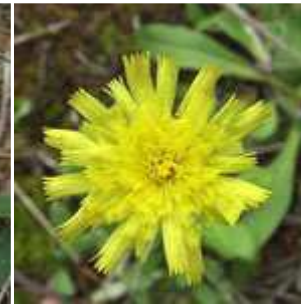
Hieracium pilosella - Kleines Habichtskraut