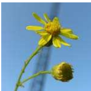
Senecio inaequidens - Schmalblättriges Greiskraut