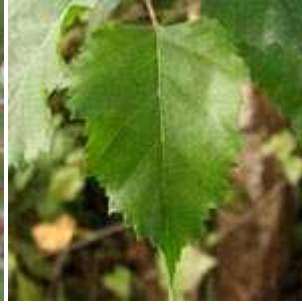
Betula pendula - Hänge-Birke