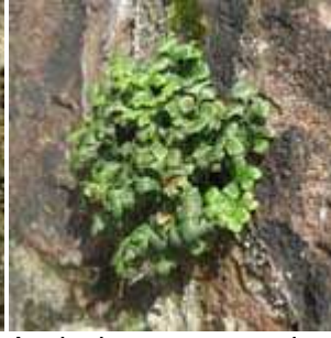
Asplenium ruta-muraria - Mauerraute