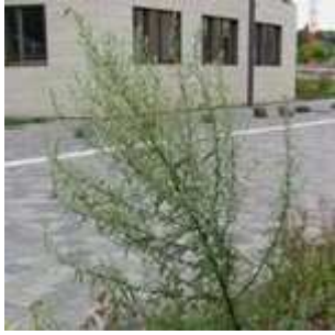
Artemisia vulgaris - Gewöhnlicher Beifuß