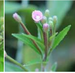
Epilobium parviflorum - Kleinblütiges Weidenröschen