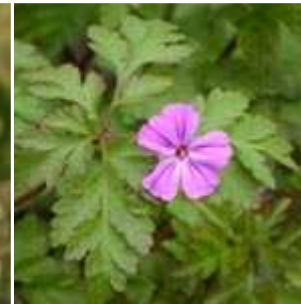
Geranium robertianum - Stinkender Storchschnabel