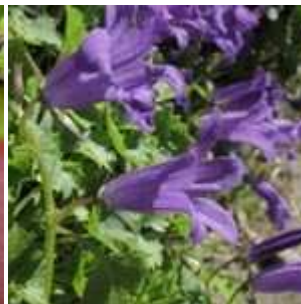
Campanula portenschlagiana - Polster-Glockenblume