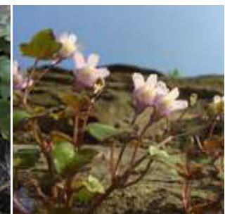
Cymbalaria muralis - Mauer-Zymbelkraut