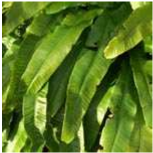
Asplenium scolopendrium - Hirschkungenfarn