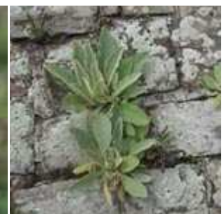
Verbascum thapsus - Kleinblütige Königskerze