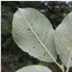
Salix caprea - Sal-Weide