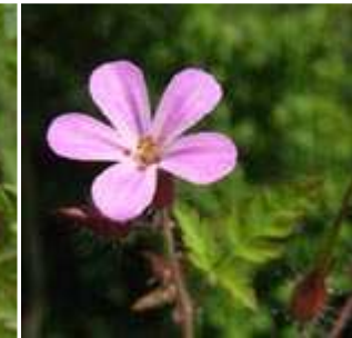
Geranium robertianum - Stinkender Storchschnabel