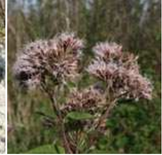
Eupatorium cannabinum - Wasserdost