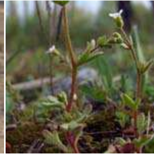
Saxifraga tridactylites - Dreifinger-Steinbrech