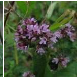
Origanum vulgare - Wilder Dost