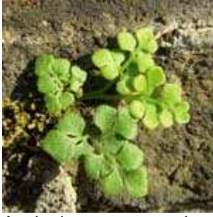
Asplenium ruta-muraria - Mauerraute