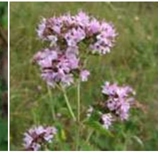
Origanum vulgare - Wilder Dost