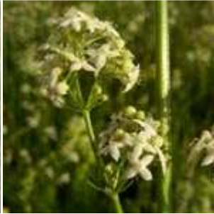
Galium album - Großblütiges Wiesen- Labkraut