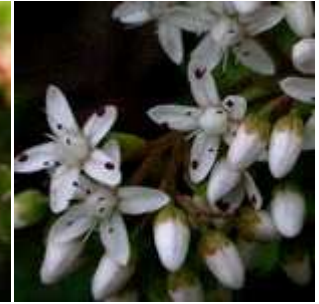
Sedum album - Weiße Fetthenne