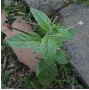
Epilobium roseum - Rosarotes Weidenröschen