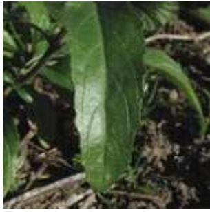
Epilobium lanceolatum - Lanzettblättriges Weidenröschen