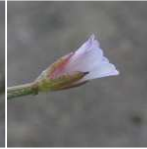
Epilobium roseum - Rosarotes Weidenröschen