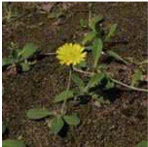
Hieracium pilosella - Mausohr-Habichtskraut