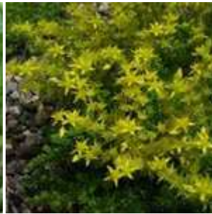
Sedum sexangulare - Milder Mauerpfeffer