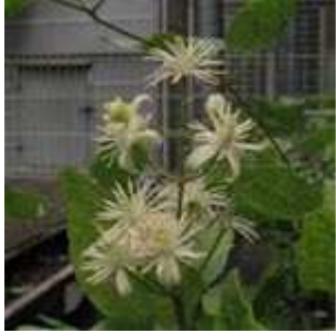
Clematis vitalba - Gewöhnliche Waldrebe