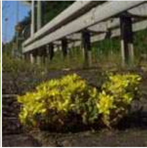
Sedum acre - Scharfer Mauerpfeffer