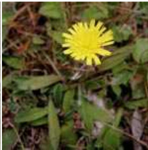
Hieracium pilosella - Mausohr-Habichtskraut