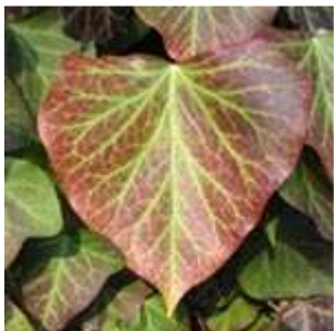
Hedera helix - Gewöhnlicher Efeu