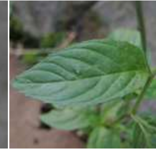
Epilobium roseum - Rosarotes Weidenröschen