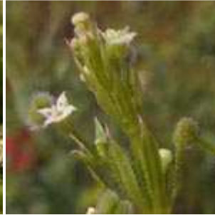
Galium aparine - Kletten- Labkraut