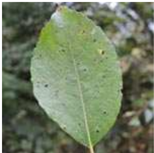
Salix caprea - Sal-Weide