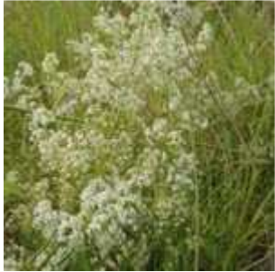
Galium album - Wiesen- Labkraut