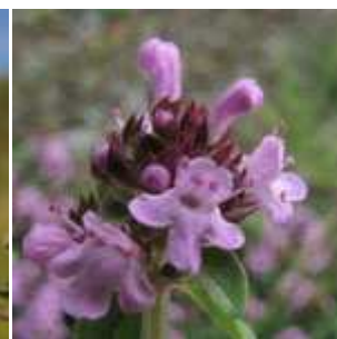
Thymus pulegioides - Feld-Thymian