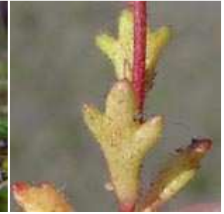
Saxifraga tridactylites - Dreifinger-Steinbrech