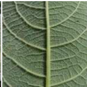
Salix caprea - Sal-Weide