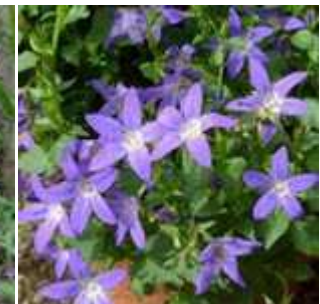
Campanula poscharskyana - Hängepolster-Glockenblume