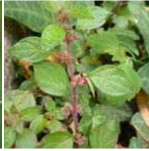
Parietaria judaica - Ausgebreitetes Glaskraut