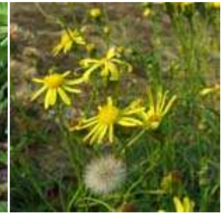
Senecio inaequidens - Schmalblättriges Greiskraut