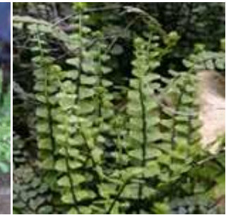
Asplenium trichomanes - Braunstielliger Streifenfarn