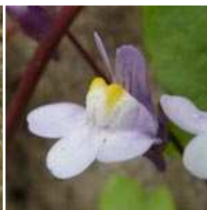
Cymbalaria muralis - Mauer-Zymbelkraut