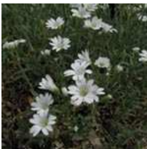
Cerastium tomentosum - Filz-Hornkraut