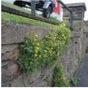
Pseudofumaria lutea - Gelber Lerchensporn