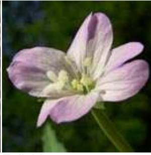
Epilobium montanum - Berg-Weidenröschen