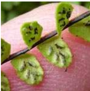
Asplenium trichomanes - Braunstielliger Streifenfarn