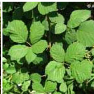
Rubus - Brombeeren (Bilderseite)