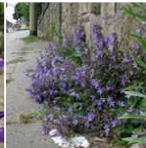
Campanula poscharskyana - Hängepolster-Glockenblume