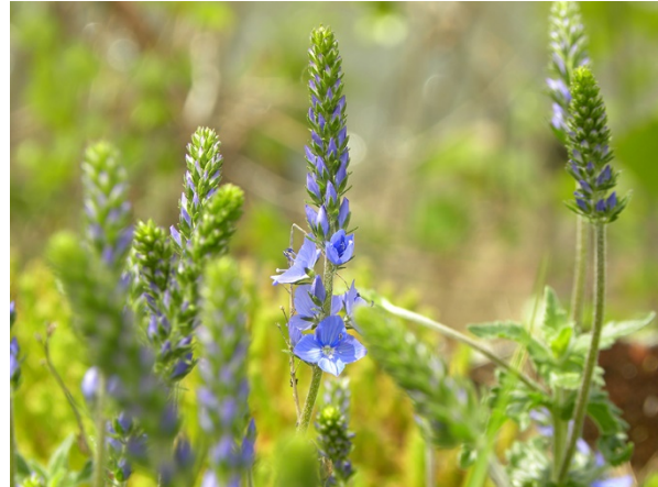
Abb. 6: Veronica teucrium (G. Falk).