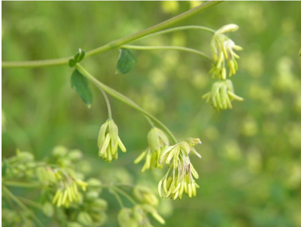
Abb. 5: Thalictrum minus subsp. pratense (G. Falk).