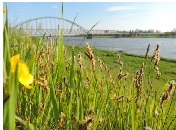
Abb. 4: Carex praecox (R. Thebud-Lassak).