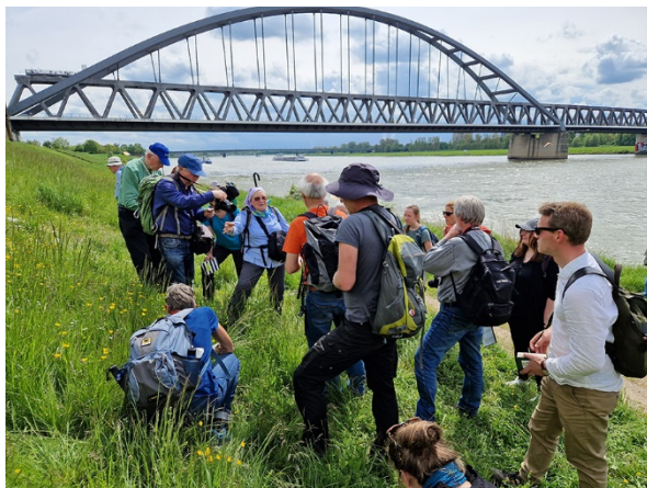
Abb. 3: Exkursionsgruppe am Rhein (C. Buch).