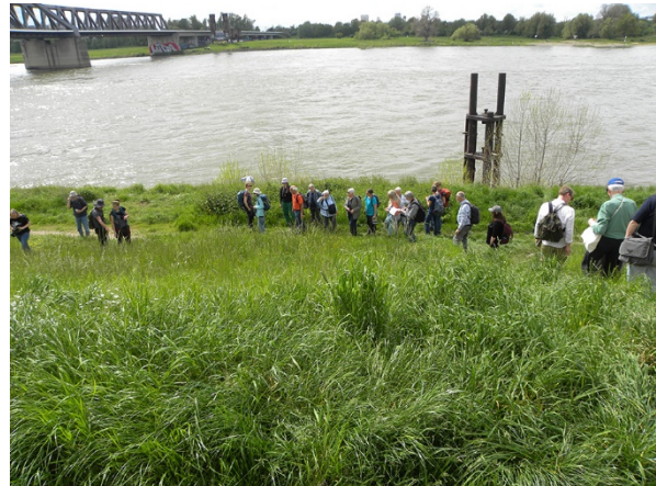
Abb. 2: Exkursionsgruppe am Rhein (G. Falk).