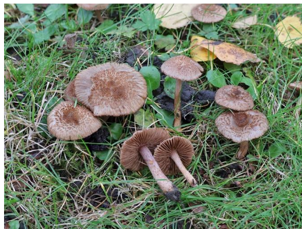
Abb. 4: Inocybe obscuroides (J. A. Mentken).