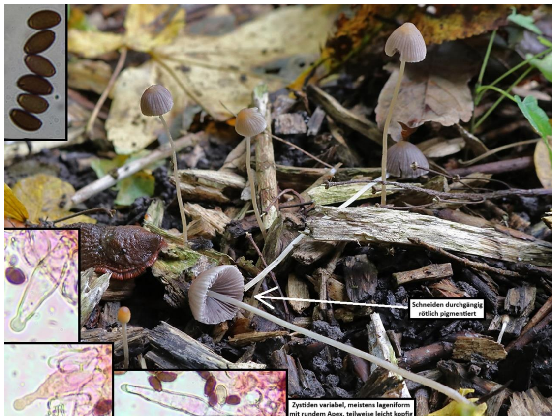
Abb. 5: Psathyrella pseudogracilis (J. A. Mentken).