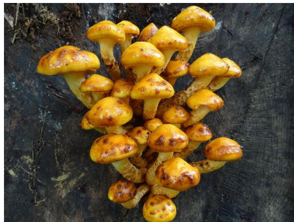
Abb. 2: Pholiota adiposa (T. Kalveram).