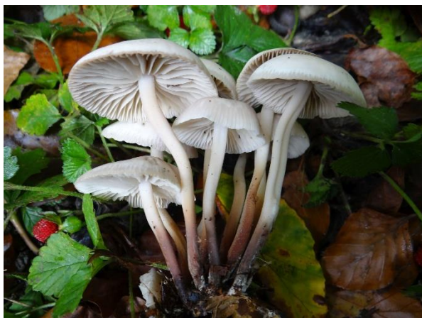
Abb. 3: Marasmius wynneae (J. A. Mentken).