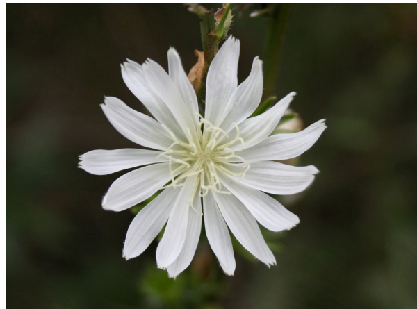
Abb. 2: Weiß blühendes Exemplar (Albino) 2008 bei Magdeburg.

Im Juli beginnt die Wegwarte mit vielen Körbchenblüten zu blühen. Die Blüten haben – anders als z. B. die Sonnenblumen – nur Zungenblüten. Sie öffnen sich nur an hellen Tagen oder bei Sonne. Gegen 15 Uhr schließen sich dann die Körbchen wieder.