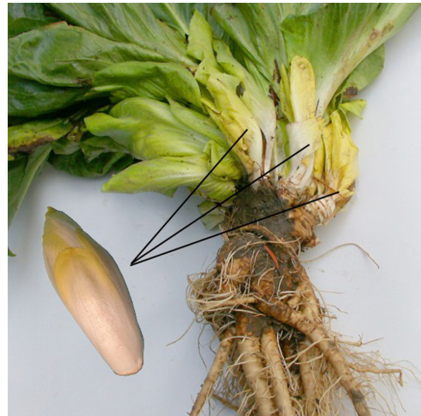
Abb. 4: Wurzeln und junge Triebe (Chicoree) der Blatt-Zichorie ( Cichorium intybus var. foliosum ).