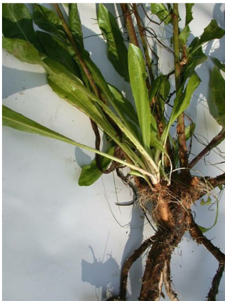
Abb. 3: Wurzeln der Wurzel-Zichorie ( Cichorium intybus var. sativum ).

Zur Gewinnung des Chicorees werden bei den Pflanzen der var. foliosum (auch Salat-Zichorie genannt) im Herbst die Blätter tief zurückgeschnitten. Die Rüben werden unter Dach im Dunklen zum "Treiben" gebracht. Es entwickeln sich spitze Blattknospen aus überwiegend weißen aufrechten Blättern, die dann als Chicoree auf den Markt kommen (Abb. 4). Da Gemüse aus der Pflanzenfamilie der Korbblütler ( Asteraceae = Compositae ) als Zuckerspeicher keine Stärke sondern Inulin enthält, kann das Gemüse auch gut von Diabetikern gegessen werden.