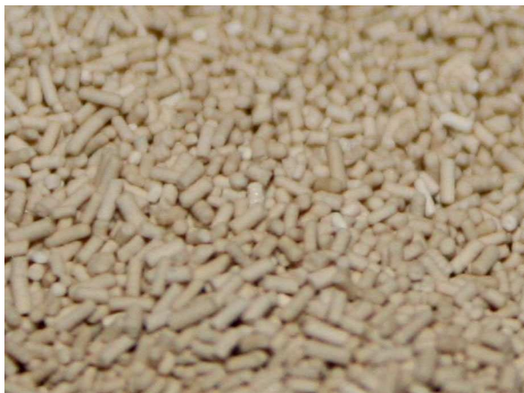
Abb. 7: Hefepellets.

In Lagertanks gärt das Bier anschließend mehrere Wochen bis Monate weiter. Die bei der Gärung als Nebenprodukt zum Alkohol entstehende Kohlensäure verbleibt durch den hohen Druck in den Tanks im Bier. Nach der folgenden Filtration wird das Bier abgefüllt und kann getrunken werden (Abb. 8). Prost!