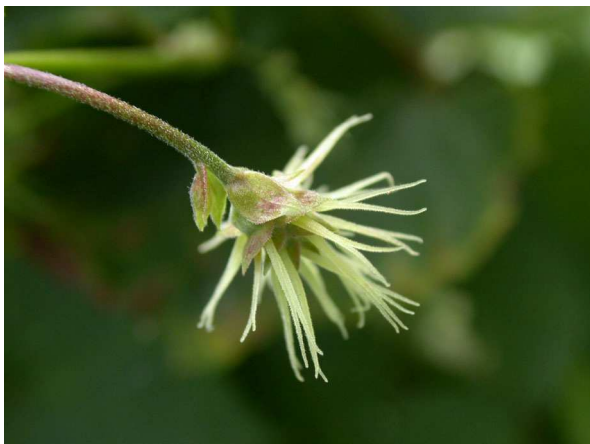
Abb. 3: Weiblicher Blütenstand zur Blütezeit.