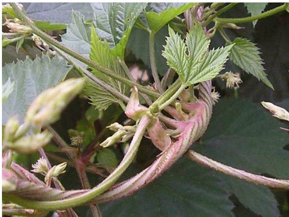
Abb. 1: Rechtswindende Triebe des Hopfens.

Die krautige Liane (Kletterpflanze) windet sich im Uhrzeigersinn um ihre Unterlage (Abb. 1), was bemerkenswert ist, weil die meisten Ranken linkswindend sind. Widerhakige Haare am rankenden Spross dienen dabei zur Befestigung und als Kletterhilfe. Die äußerst dekorativen Blätter des Hopfens sind, je nach Blattnalter, (0)3-7(9)-lappig, werden bis 20 cm lang und sind am Rand gesägt (Abb. 2). Hopfenpflanzen können ein Alter von bis zu 50 Jahren erreichen.