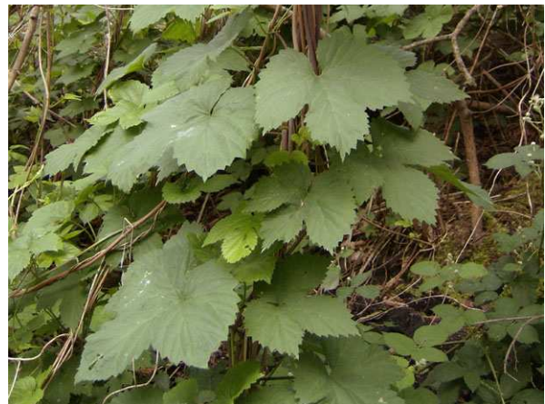
Abb. 2: Blätter.