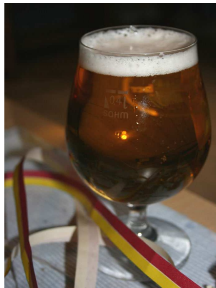
Abb. 8: Glas Bier am Rosenmontag (Foto: C. BUCH).