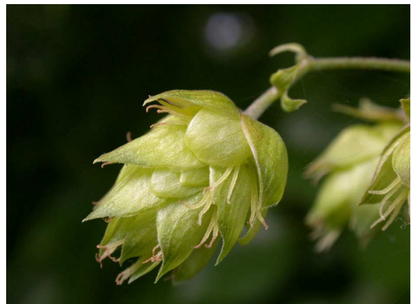
Abb. 4: Weiblicher Blütenstand in einem älterem Stadium, die sog. Hopfendolden.