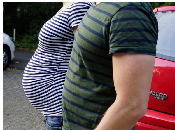
Abb. 10: Hypericum perforatum (Tüpfel-Johanniskraut), mögliche Nebenwirkung (A. JAGEL).