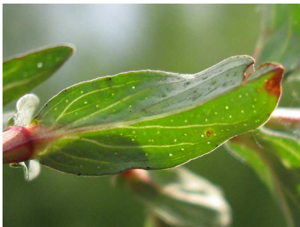
Abb. 5: Hypericum perforatum (Tüpfel-Johanniskraut), Blatt von unten mit durchscheinenden Ölbehältern auf der Fläche und schwarzen Ölbehältern am Blattrand.