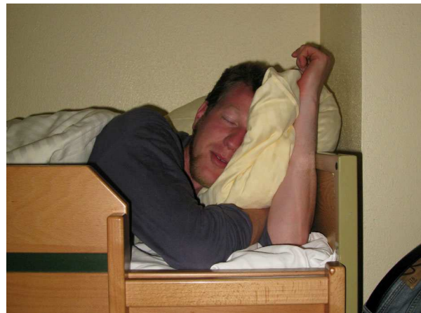
Abb. 8: Hypericum perforatum (Tüpfel-Johanniskraut), gewünschte Wirkung (A. JAGEL).

Allerdings ist die Annahme, dass pflanzliche Arzneimittel im Gegensatz zu synthetischen Produkten frei von Nebenwirkungen wären, falsch und kann im Fall von Johanniskraut weitreichende Konsequenzen haben. So senkt der Wirkstoff Hypericin die Lichtempfindlichkeit von Haut und Augen, was insbesondere bei intensiverer Sonnenlichtexposition zu Verbrennungen führen kann (Abb. 9). Dies kann sogar dann geschehen, wenn man lediglich Johanniskrautöl in Salaten verwendet.