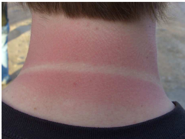
Abb. 9: Hypericum perforatum (Tüpfel-Johanniskraut), häufige Nebenwirkung (A. JAGEL).

Allerdings ist die Annahme, dass pflanzliche Arzneimittel im Gegensatz zu synthetischen Produkten frei von Nebenwirkungen wären, falsch und kann im Fall von Johanniskraut weitreichende Konsequenzen haben. So senkt der Wirkstoff Hypericin die Lichtempfindlichkeit von Haut und Augen, was insbesondere bei intensiverer Sonnenlichtexposition zu Verbrennungen führen kann (Abb. 9). Dies kann sogar dann geschehen, wenn man lediglich Johanniskrautöl in Salaten verwendet.