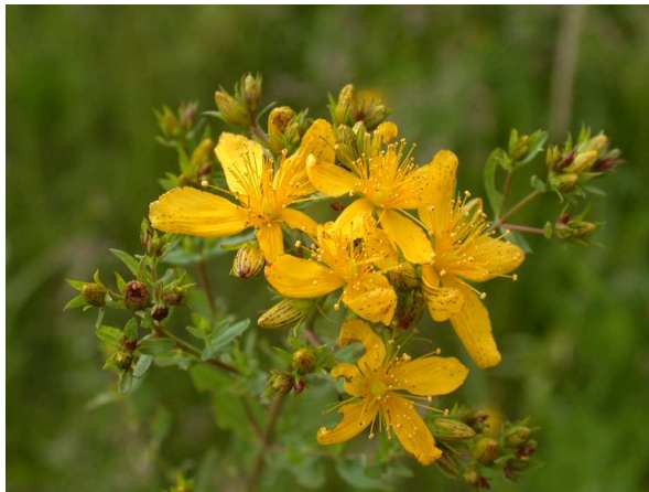
Abb. 1: Hypericum perforatum (Tüpfel-Johanniskraut), blühend (16.06.2004,).

Die Arzneipflanze des Jahres 2015 ist das Tüpfel-Johanniskraut. Die Wahl führt jährlich der Studienkreis Entwicklungsgeschichte der Arzneipflanzenkunde durch und er begründete seine diesjährige Entscheidung mit der "traditionellen und aktuellen Bedeutung" der Pflanze (UNIVERSITÄT WÜRZBURG 2014). Trotz der jahrhundertelangen und vielfältigen Anwendung sind die Wirkungsmechanismen bis heute noch nicht vollständig geklärt und die Inhaltsstoffe sind Gegenstand aktueller pharmazeutischer Forschung. Dem Botaniker im Ruhrgebiet fällt jedoch beim Johanniskraut zunächst der sommerliche Blühaspekt offener Industriebrachen ein, der durch Hypericum perforatum entscheidend mitgeprägt wird.