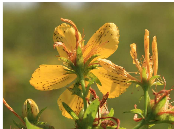
Abb. 4: Hypericum perforatum (Tüpfel-Johanniskraut), Blüte von unten mit schwarzen Ölbehältern auf Kron- und Kelchblättern (16.06.2004,).