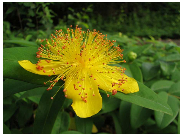
Abb. 6: Hypericum calycinum (Großkelchiges Johanniskraut), Blüte (01.07.2010,).