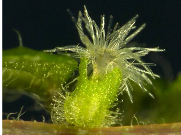
Abb. 10: Weibliche Bubikopf-Blüte von der Seite, die einzelne Blüte sitzt in einer Röhre aus Tragblättern (V. M. DÖRKEN).