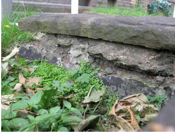
Abb. 5: Bubikopf am Rand eines Zierrasens in Witten an einer Mauer empor kletternd (A. JAGEL).