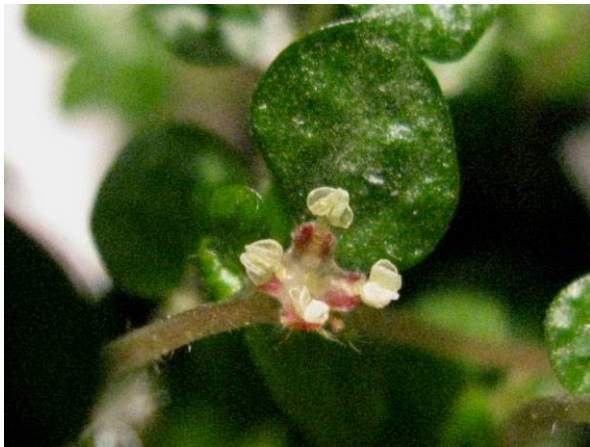
Abb. 11: Männliche Bubikopfblüte mit vier rötlichen Blütenblättern und vier blassgelben Staubblättern (A. JAGEL).