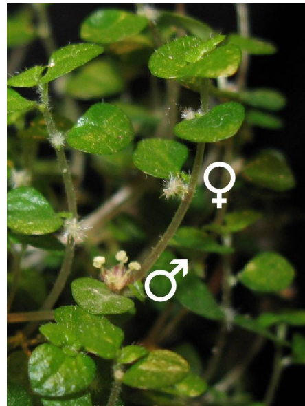
Abb. 8: Blühender Bubikopf-Trieb, die männliche Blüte (♂) steht unterhalb der weiblichen Blüte (♀).

Die Blüten sind mit einer Größe von etwa 1 mm winzig klein und fallen kaum auf (Abb. 7 & 8). Sie sind windbestäubt (anemophil, möglicherweise vom sog. Explosionstyp wie bei Brennnesseln) und daher im Aufbau stark reduziert. Die Blüten weisen vier miteinander verwachsene Blütenblätter (Tepalen) auf, die aber von außen nicht zu sehen sind, da die weibliche Blüte außerdem von einer Röhre aus grünen, verwachsenen Tragblättern umschlossen ist. Nur ein Büschel von silbrig glänzenden Narbenästen schaut aus der Röhre heraus. Die männliche Blüte hat eine solche Röhre nicht, hier sind vier Blütenblätter und vier Staubgefäße zu erkennen.