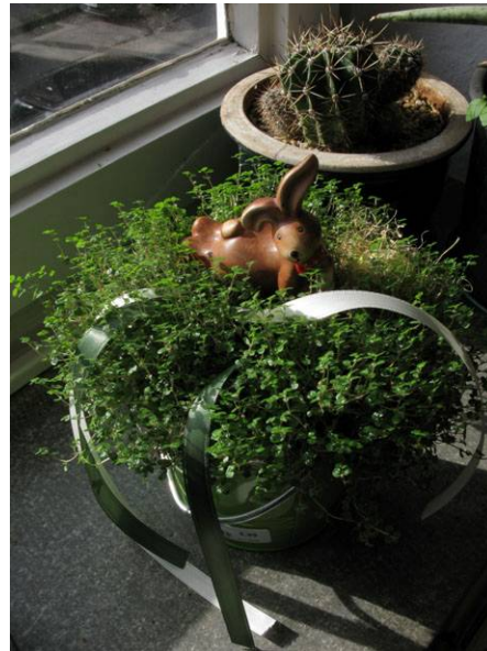
Abb. 2: Soleirolia soleirolii , österlicher Bubikopf auf der Fensterbank.