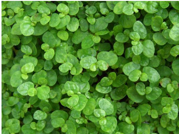
Abb. 1: Soleirolia soleirolii , Nahaufnahme der Triebe eines Bubikopfes (A. JAGEL).

Der Bubikopf ist schon seit Anfang des 20. Jahrhunderts als Zimmerpflanze in Kultur und auch heute noch ganzjährig im Pflanzenhandel erhältlich. Dem Gärtner ist schon länger bekannt, dass die Art auch bei uns milde Winter im Freiland überdauern kann. Für den Botaniker ist aber interessant, dass der Bubikopf offensichtlich immer häufiger auch verwildert und dabei Fröste von unter -10\text{ }^{\circ}\text{C} schadlos überdauert. Im Ruhrgebiet haben sich verwilderte Bubikopf-Vorkommen in Zierrasen als vollkommen winterhart erwiesen. Blühende Pflanzen sieht man selten, oder vielmehr: Man übersieht sie! Die Beobachtung von Blüten in mehreren Gartencentern und auch an verwilderten Exemplaren in den Monaten März bis Mai 2011 gaben den Anlass, die Morphologie und Verbreitung der Art hier näher vorzustellen.