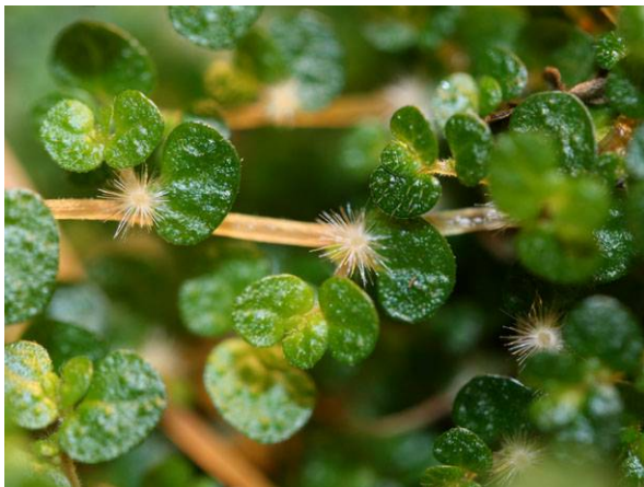
Abb. 7: Bubikopf-Trieb mit unauffälligen, weiblichen Blüten (C. BUCH).

Als Vertreter der Urticaceae ist die Art getrenntgeschlechtlich, aber anders als bei der zweihäusigen Großen Brennnessel wachsen hier männliche und weibliche Blüten auf einer Pflanze, sie ist also monözisch. Nach TUTIN & al. 1993 und BOLÓS & al. 2005 stehen an einem Ästchen zuerst die weiblichen Blüten, dann folgen zum Zweigende hin die männlichen. Bei den im März 2011 selbst beobachteten blühenden Pflanzen war es allerdings durchweg genau andersrum (Abb. 8). Außerdem traten in verschiedenen Gartencentern in Bochum, Dortmund, Witten, Mülheim und Konstanz auch rein weibliche und rein männliche Pflanzen auf.