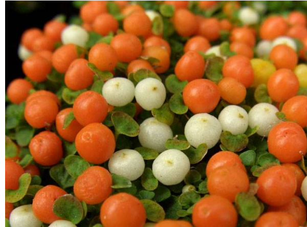
Abb. 4: Nertera granadensis (Korallenmoos). Pflanzen mit weißen und orangen Früchten vermisch in einem Topf.

Der deutsche Name Bubikopf, oder auch Bubiköpfchen, geht auf die weibliche Kurzhaarfrisur aus den Jahren nach dem 1. Weltkrieg zurück, an die die Pflanze – als Topfpflanze kultiviert – erinnerte (MARZELL 1972). Im Englischen hat die Art viele Namen, wie z. B. Mother-of-Thousands, Mind-our-own-business, Irish Moss oder Baby's Tears. Im Lateinischen hieß sie zunächst Helxine soleirolii . Da die Gattung Helxine aber früher schon einer anderen Art zugeordnet worden war, wurde der Bubikopf 1965 von JAMES EDGAR DANDY zu Soleirolia soleirolii umkombiniert. Der Name erinnert an den französischen Ingenieurs-Offizier JOSEPH-FRANCOIS SOLEIROL, der die Art auf Korsika im Jahr 1820 fand.