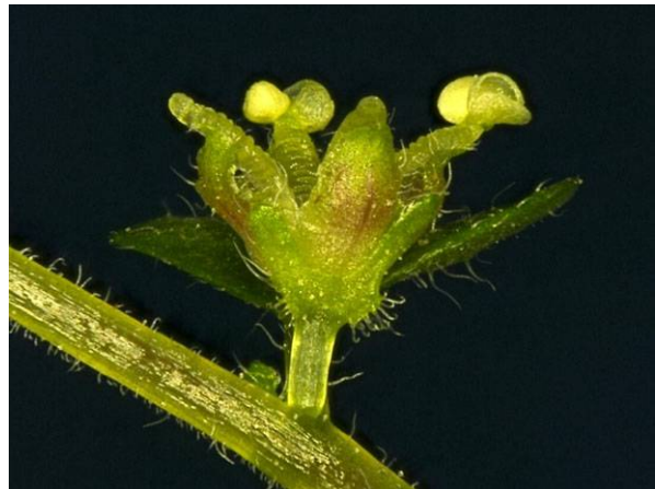
Abb. 12: Männliche Bubikopfblüte von der Seite. Die schmalen grünen Tragblätter an der Basis der Blüte sind nicht zu einer Röhre verwachsen.

Über Blüten an verwilderten Pflanzen in Deutschland ist bisher nichts bekannt, was daran liegen dürfte, dass sie aufgrund ihrer Unauffälligkeit leicht übersehen werden können. Denn nachdem von den Autoren beobachtet worden war, dass die Art in Gartencentern regelmäßig blüht, wurde auch ein Großteil der bekannten verwilderten Vorkommen in Bochum-Grumme und Bochum-Ehrenfeld am 1. Mai 2011 aufgesucht. Dabei wiesen alle Bestände sowohl männliche als auch weibliche Blüten auf. Bisher herrscht die Meinung vor, alle Verwilderungen seien aus herabfallenden Trieben entstanden, die sich leicht bewurzeln und nach Etablierung von Zierrasen zu Zierrasen mit dem Rasenmäher verschleppt werden (vgl. ADOLPHI & HUMSER 1991, JAGEL & BUCH 2011). Die nun erstmals beobachtete Blütenbildung im Freiland lässt aber die Möglichkeit zu, dass die Art sich auch über Samen ausbreiten könnte. Früchte könnten bisher noch nicht beobachtet werden was aber auch durch die häufige Mahd der Wuchsorte begründet sein könnte. Als Zimmerpflanzen gehalten, blühte die Art bis Mitte Juli und auch im Freiland konnten noch Blüten im Juni beobachtet werden.