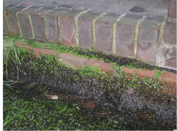
Abb. 6: Bubikopf am Fuß einer Hauswand in Bochum-Ehrenfeld. Die Pflanzen im angrenzenden Rasen sind bei tiefen Frösten zurückgefroren, die Exemplare an der Hauswand blieben den ganzen Winter grün (09.01.2011,).