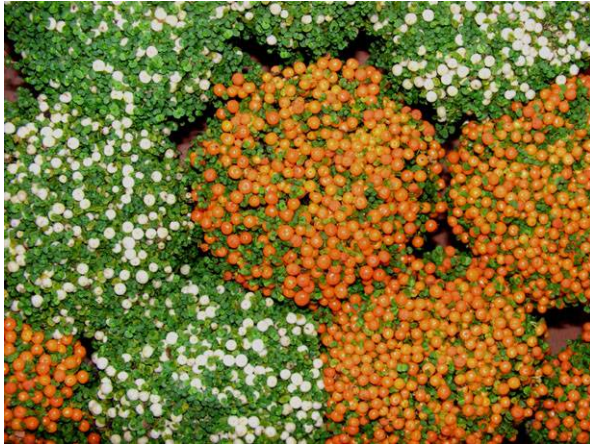
Abb. 3: Nertera granadensis , das mit dem Bubikopf nicht näher verwandte Korallenmoos im Angebot eines Blumenhandels (A. JAGEL).

sich bei dem orange (oder weiß) fruchtenden "Korallenmoos" (Abb. 3 & 4) um fruchtende Bubiköpfe handelt. Das Korallenmoos ( Nertera granadensis ) gehört vielmehr zu den Rötengewächsen ( Rubiaceae ) und unterscheidet sich auch vegetativ vom Bubikopf durch die gegenständigen Blätter, wohingegen der Bubikopf, anders als die Brennnesseln ( Urtica ), wechselständige Blätter hat.