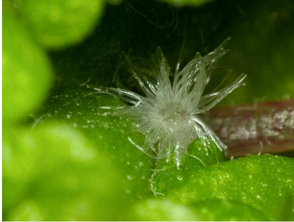
Abb. 9: Weibliche Bubikopf-Blüte in Aufsicht, zu sehen sind nur die büschelig stehenden Griffeläste (V. M. DÖRKEN).